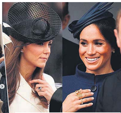
Блогер часто сравнивает модные луки герцогинь: Кейт пока превосходит Меган в искусстве дресс-кода. Ах, Меган, носить сразу несколько колец - дурной тон!