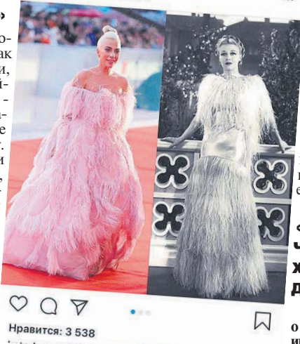
А вы знали, почему в эпоху Великой депрессии носили «пернатые» наряды? Все это можно узнать в блоге Кати.

лайн-школе учатся стилисты и дизайнеры со всего мира: из России, Англии, Франции, Германии. А 90% моих подписчиков в Инстаграме - это россияне. Поэтому каждый месяц устраиваю для фолловеров встречи в Москве и Петербурге. Вскоре планирую проводить их и в Минске. Это хорошо сближает с аудиторией: подписчики приходят на тебя посмотреть, пообщаться и даже иногда дарят подарки. Что очень мило!