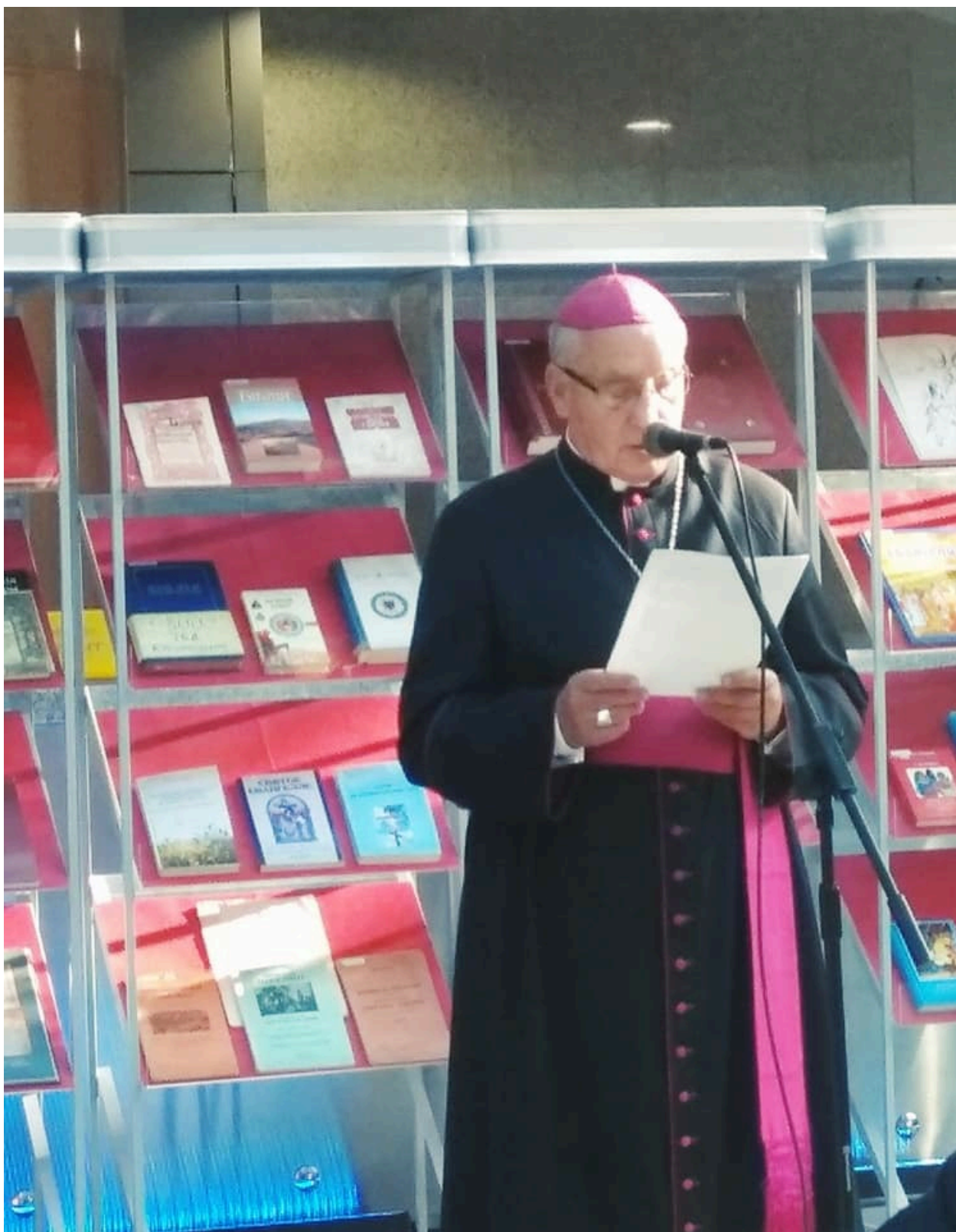
Мітрапаліт Тадэўш Кандрусевіч : "Беларусь унікальная тым, што спалучыла заходнюю і ўсходнюю традыцыю Бібліі"