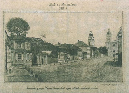
Від Віцебска ў 1860 годзе. Дабравешчанская царква ў Віцебску (з кнігі Аляксея Сапунова)

Першая выстава ў гэтым шэрагу прысвечаная асобе і дзейнасці Аляксея Сапунова, бо гэты даследчык таксама ў невялікай ступені спрычыніўся да ўзбагачэння кнігазбору і станаўлення будучай Нацыянальнай бібліятэкі. Экспа-