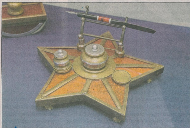
Пісьмовы набор маршала Цімашэнкі.

— Сярэбраная асадка з надпісам «20 кіламетраў», каму належала, невядома. Я набыў яе з цікавасці. Калі пачаў вывучаць гэты надпіс, знайшоў