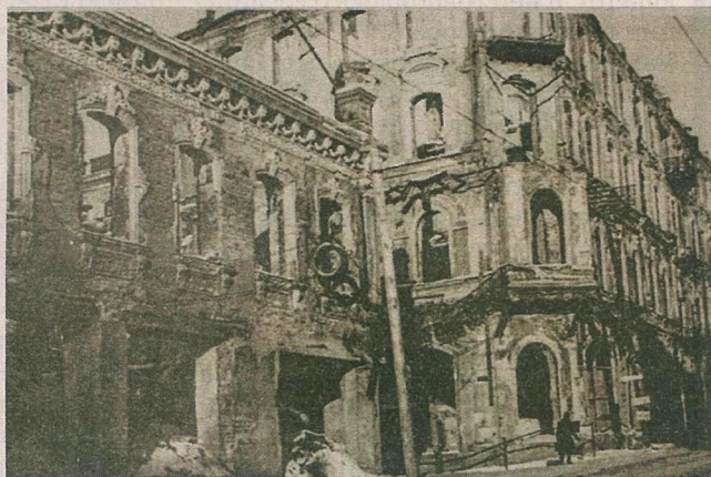
▲ Центр Минска, 1942 год

Украшает выставку собрание литографий (на основе рисунков) одного из немногих выживших участников похода на Россию Наполеона I Бона-