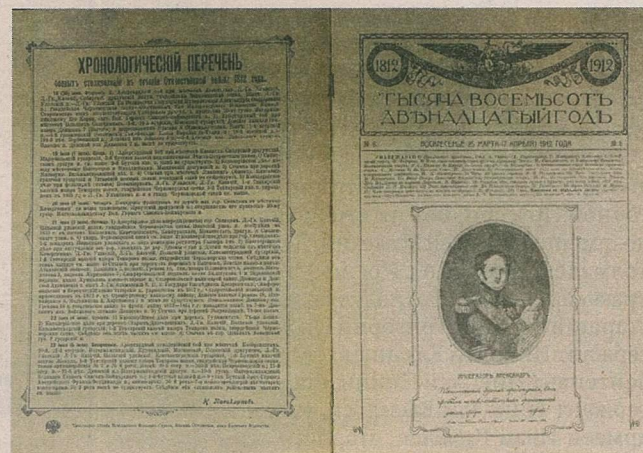
▲ Альманах к 100-летию Отечественной войны 1812 года