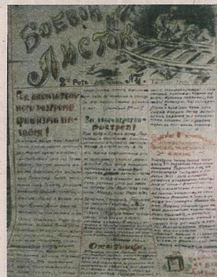
▲ Образец «Боевого листка» частей Красной Армии

жем увидеть Беларусь начала XIX века: архитектуру, природу, костюмы и быт местных жителей.