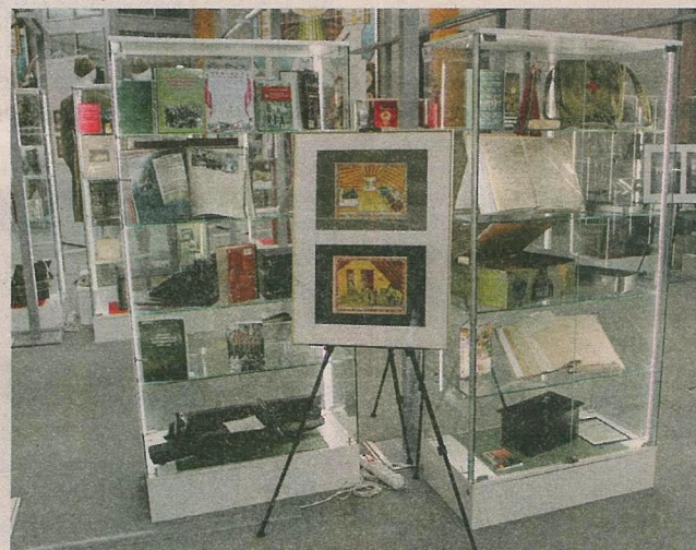
▲ Один из разделов выставки