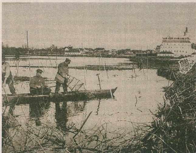
▲ Окрестности Пинска, рыбная ловля в дни затишья, 1916 год

Денис Трофимычев, «Ваяр»