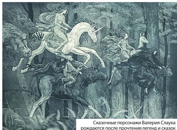
Сказочные персонажи Валерия Слаука рождаются после прочтения легенд и сказок

– По последним данным ученых, ящеры, которые показаны в картине Спилберга, выглядели далеко не так. Говорят, они могли быть обросшие мехом, перьями. Причем не только хладнокровные, но и теплокровные. Поле для воображения здесь широкое.