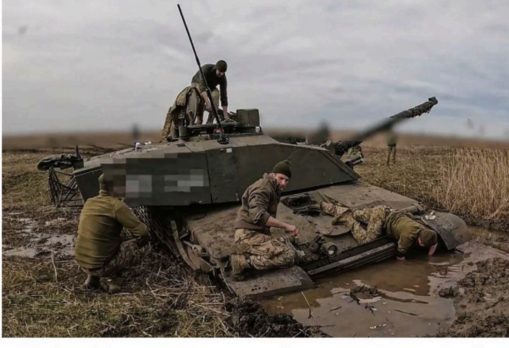
Британский танк Challenger 2 на вооружении украинской армии не выдержал тяжелых условий тыла.

Ситуация вокруг украинского вооруженного конфликта напоминает постоянно колеблющиеся весы. Уж простите за избытое сравнение, но лучше не придумайшь. То следует целая серия заявлений о переговорах, то вдруг раздаются боевые кличи и бряцание оружием. Сейчас наступила стадия очередной эскалации, весьма опасной.