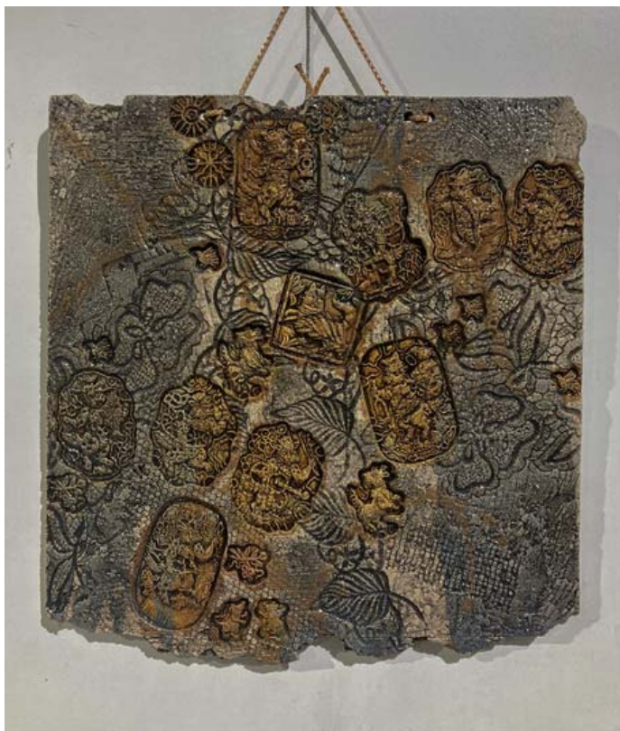
Валерый Калтыгін. З цыкла «Божыя істоты ў квадраце», 2024 г.

На думку арганізатараў і Валерыя Калтыгіна, з супрэматызмам яго і сына дэкаратыўную кераміку яднае тое, што формаўтваральныя, кампазіцыйна-вобразныя рашэнні ў асацыятыўнай творчасці мастакоў свядома здзяйсняюцца праз абстракцыю, канструктывізм, сюррэалізм, трансфармацыю і іншыя сродкі сучаснага мастацтва, у спалучэнні іх элементаў... Між тым для аўтараў істотны цікавыя, часцей пазнавальныя, хоць і відазмененыя вобразы, творцы імкнуцца перадаць іх дэталі і адметнасці. Метады і прыёмы супрэматызму ім не чужыя.