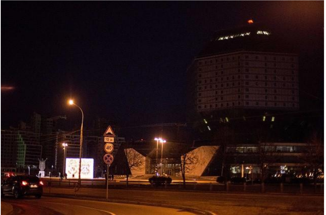
Национальная библиотека

У Национальной академии наук Беларуси и Купаловского театра подсветка вообще целый вечер не включалась, и это стало особенностью проведения нынешнего Часа Земли.