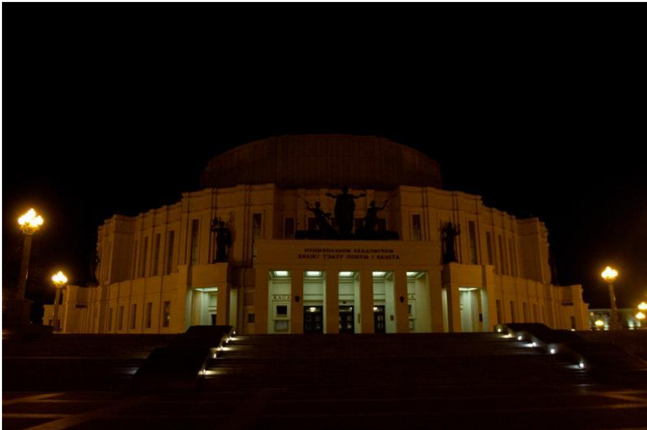
Большой театр оперы и балета

Беларусь уже не первый раз принимает участие в Часе Земли, постепенно наращивая масштаб вовлеченности. Если в прошлом году акция прошла в 11 городах и деревнях, то теперь присоединились все регионы страны.