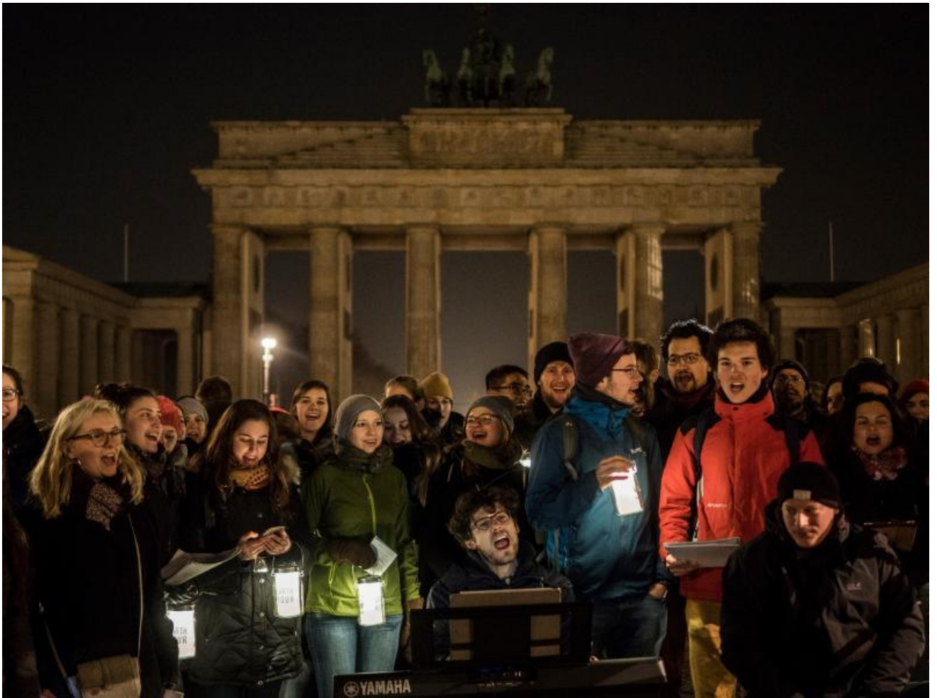
Бранденбургские ворота, Германия