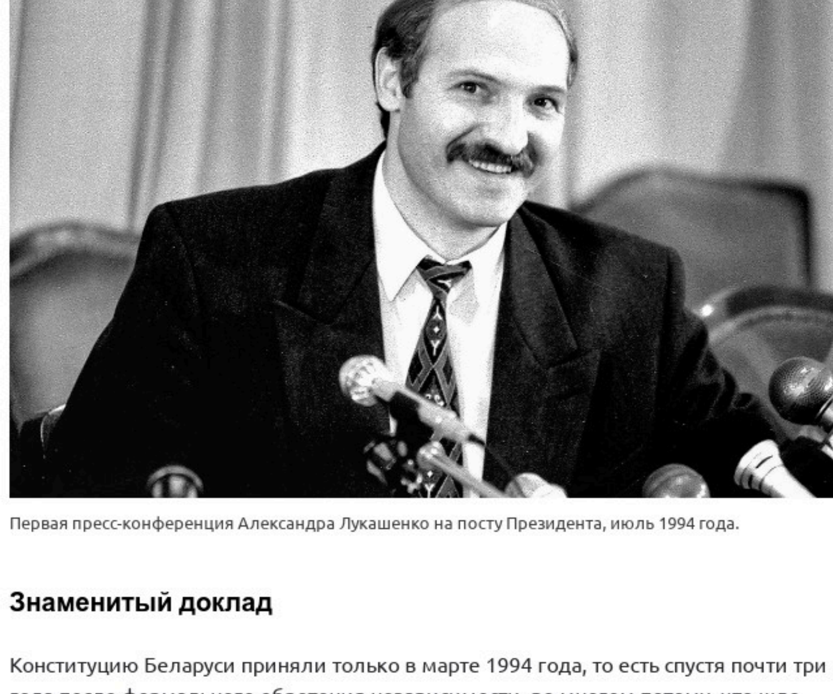
Первая пресс-конференция Александра Лукашенко на посту Президента, июль 1994 года.

Президентская республика. За этим сухим правовым и политологическим определением стоит очень многое. И наши традиции, и выбор народа, и мандат доверия человеку, который определяет судьбу развития целой страны. Институт президентства оказался спасительным для Беларуси. И родился он вместе с нашей современной государственностью, во многом став синонимом подлинной независимости и суверенитета.