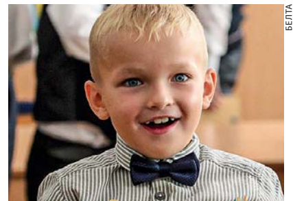
Такі Буквар дзецям на радасць

Як адзначыла аўтар новага выдання для першакласнікаў Вольга Свірыдэнка, у ім сабраны лепшыя класічныя метадыкі навучання грамаце. “Мы імкнуліся да таго, каб Буквар навучаў дзяцей чытаць. Разам з тым мы разумеем, што нашы дзеці жывуць у інфармацыйнай прасторы