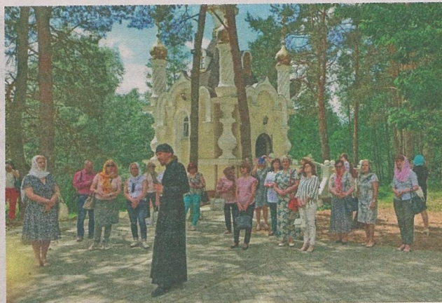
Падчас экскурсіі ў Свята-Елісееўскі Лаўрышаўскі манастыр.

Ёсць яшчэ адна рэлігійная слава на Навагрудчыне, якая заслугоўвае ўвагі і якую наведалі ўдзельнікі Шчорсаўскіх чытанняў — гэта Свята-Елісееўскі Лаўрышаўскі мужчынскі манастыр, які ў XIII стагоддзі быў цэнтрам летапісання ў Беларусі. Каля 1329 года тут было напісана рукапіснае Евангелле — помнік беларускага кнігапісання, якое цяпер захоўваецца ў бібліятэцы Чартаўскіх у Кракаве. У XVI стагоддзі пры манастыры дзейнічала школа, мелася багатая бібліятэка. Манастыр знаходзіцца па-суседстве са Шчорсамі, таму, зразумела, удзельнікі чытанняў наве-