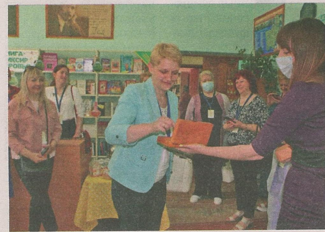
Інтэрактыўнае падарожжа па Наваградскай раённай бібліятэцы.

гой секцыі. Святар мае масу прапаноў як для аднасьляччан, так і для пілігрымаў. Пры касцёле арганізаваны і на належным ўзроўні забяспечаны рэлігійны і пазнавальны адпачынак, таму зараз сюды з цікаўнасцю і задавальненнем едуць вандроўнікі з розных куткоў Беларусі, і не толькі. Ксёндз Віталій мае мару — “стварыць ва Уселюбе духоўна-турыстычны комплекс, каб людзі з усяго свету даведаліся аб нашым выдатным месцы, касцёле, святых і гісторыі тутэйшых месцаў”. Касцёл знаходзіцца ў 13 кіламетрах ад Навагрудка ў Іўеўскім напрамку, і ксёндз Віталій запрасіў прысутных наведаць яго парафію. Да месца будзе сказаць, што 21 жніўня тут адбудзецца фестываль-рэкалекцыя Novafest.