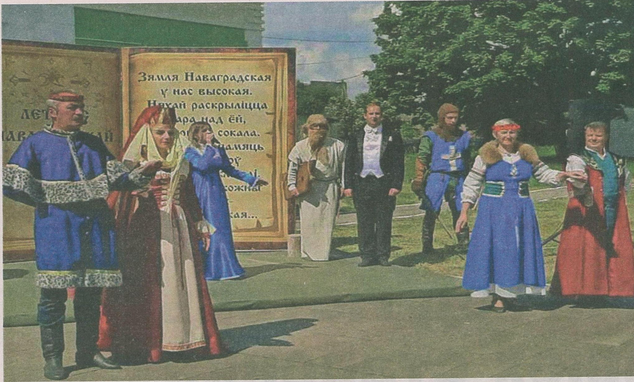
Літаратурна-музычная кампазіцыя “Гістарычныя постаці мінулага”.