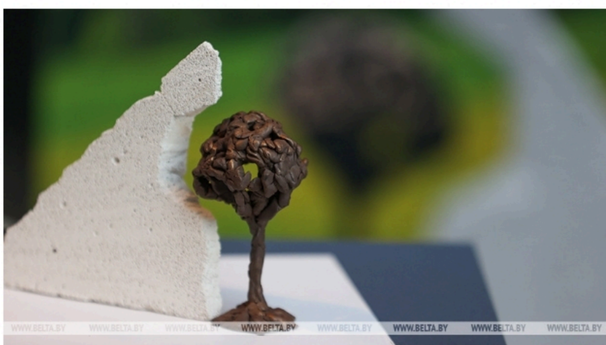
Макет памятного знака "Живая память благодарных поколений"

2 июля, Минск /Корр. БЕЛТА/. Макет эскиза к памятному знаку проекта "Дети Беларуси - ветеранам и будущим поколениям" презентован в музее истории Великой Отечественной войны, передает корреспондент БЕЛТА.