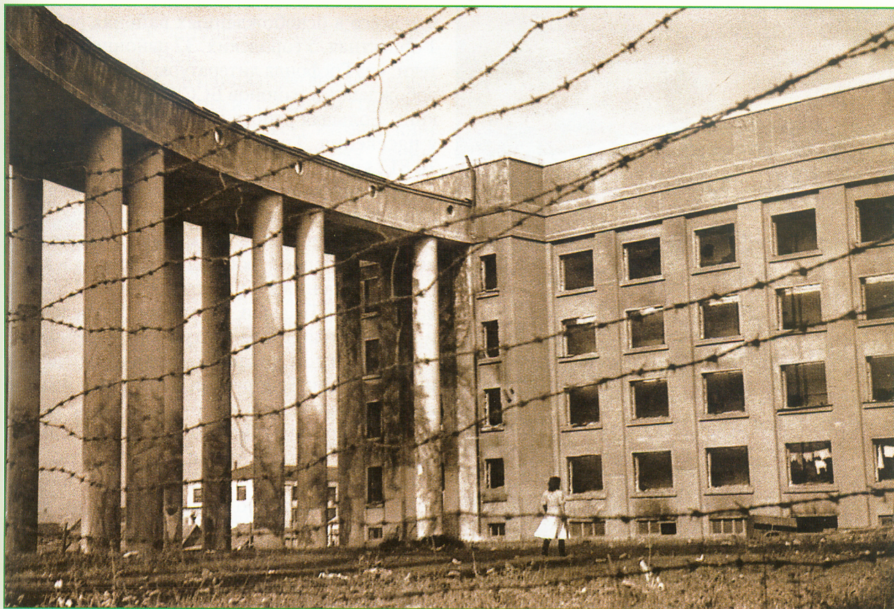
Здание Академии наук БССР в годы Великой Отечественной войны