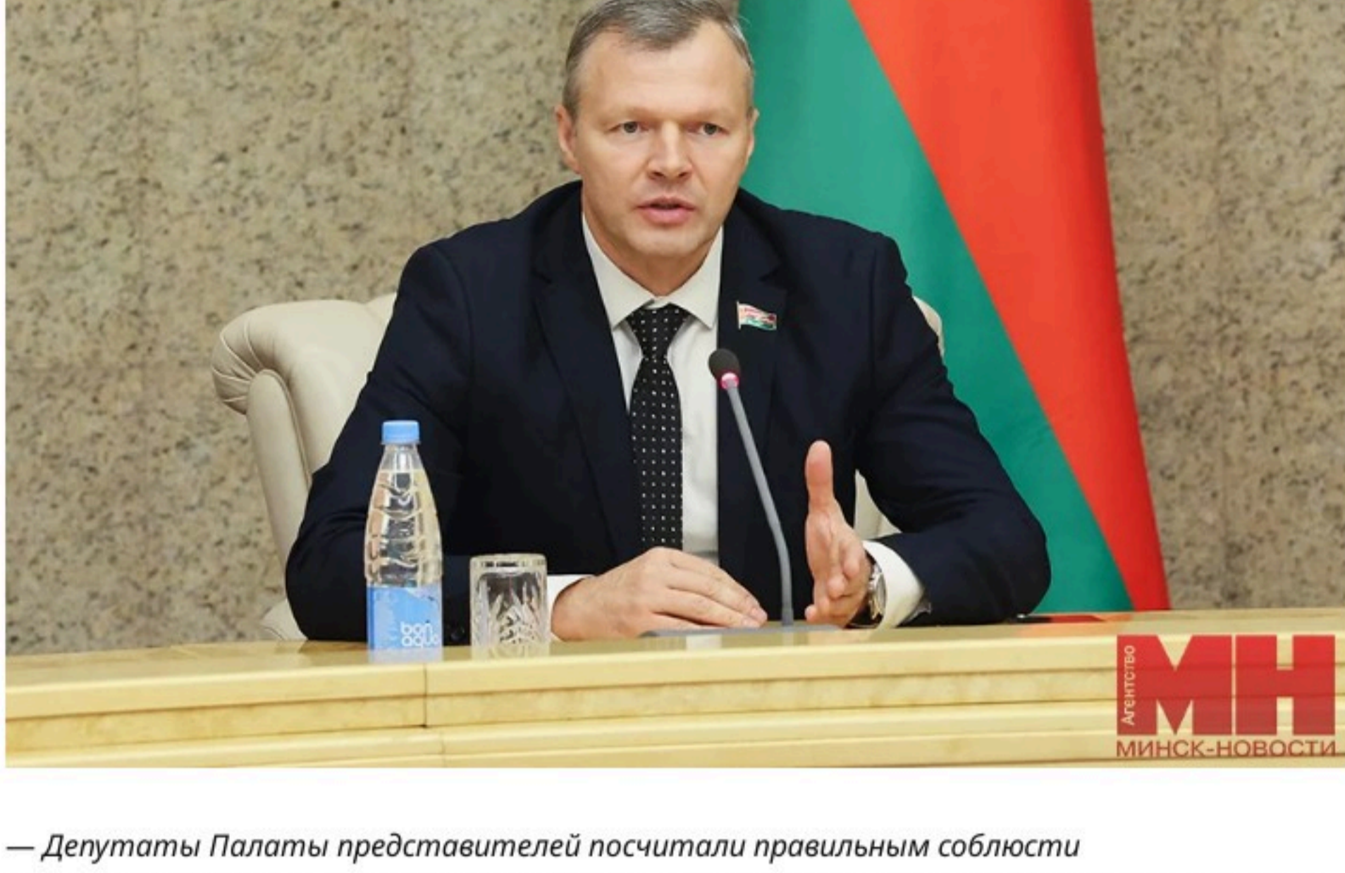
Председатель Белорусской партии «Белая Русь» Олег Романов

— Депутаты Палаты представителей посчитали правильным соблюсти преемственность с электоральными кампаниями 2024 и 2022 годов, которые проходили в зимний период. К этому времени можно оптимально подготовить всю избирательную инфраструктуру. Также это наиболее удобно для волеизъявления граждан, потому что большинство людей зимой находится на местах, а не в отпусках и зарубежных туристических поездках.