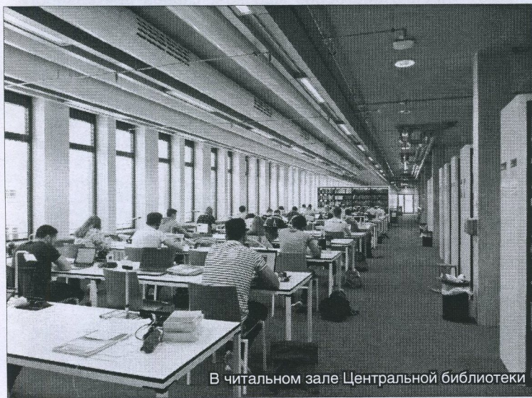
В читальном зале Центральной библиотеки

Иная тенденция отмечается в отношении научных журналов. Спрос и, соответственно, подписка на бумажные журналы постоянно сокращается; высказывается мнение