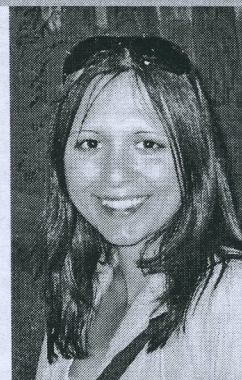
Заведующий отделом Национальной библиотеки Беларуси

Наша любимая профессия, наверное, как никакая другая, дарит нам возможность расширять горизонты знания и открывает для нас мир. А узнавая этот мир, мы и сами становимся открытыми для него. Так и меня на профессиональном пути повстречала возможность пройти стажировку в библиотеке Университета Иоганна Гутенберга в немецком г. Майнц. Четырехнедельная программа стажировки в апреле 2018 г. была рассчитана на знакомство со всеми направлениями деятельности университетской библиотеки. Полученные опыт и впечатления, безусловно, невозможно полностью изложить в рамках одной статьи, поэтому на этих страницах хочу поделиться только самыми интересными наблюдениями.