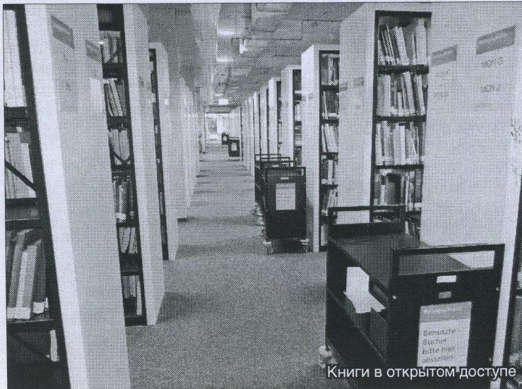
Книги в открытом доступе

названий научных журналов. Стремление обеспечить максимально широкий доступ к научной периодике совпадает с подходами в комплектовании фонда ЭИР научных и учебных библиотек Беларуси. Наряду с этим в Германии набирает уверенный рост еще одна тенденция, на данный момент менее выраженная в белорусских библиотеках, – увеличение объемов комплектования электронными книгами, причем не только в составе пакетов баз данных, но и поштучное приобретение электронных книг в постоянное пользование. Так, на сегодняшний момент соответствующий фонд университетской библиотеки уже превышает 69 тысяч электронных книг. При этом, конечно же, необходимо учитывать, что формирование фонда электронных книг актуально, прежде всего, для информационного обеспечения гуманитарных и общественных наук.