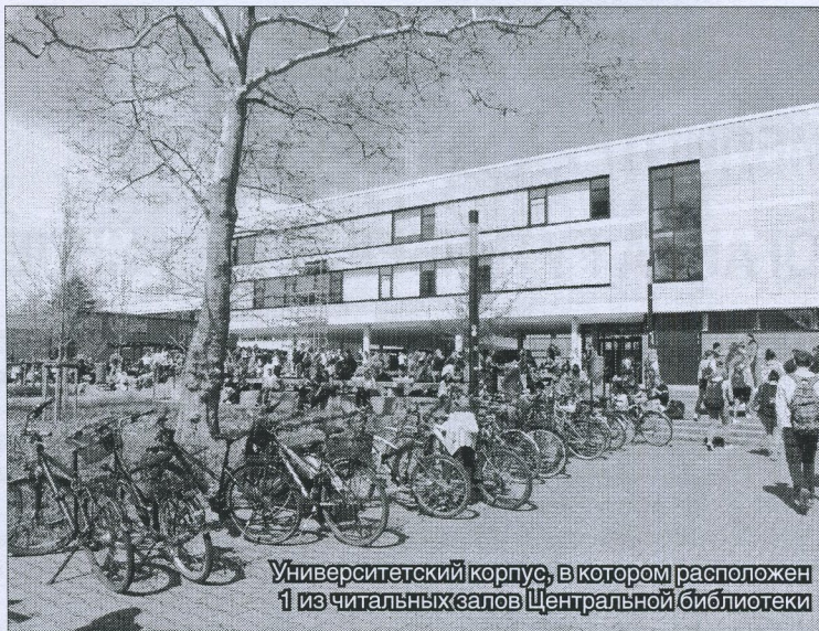
Университетский корпус, в котором расположен 1 из читальных залов Центральной библиотеки

Работа по формированию информационных ресурсов направлена на удовлетворение актуальных информационных потребностей пользователей. Главным критерием оценки документов является их востребованность; проводится постоянная целена-