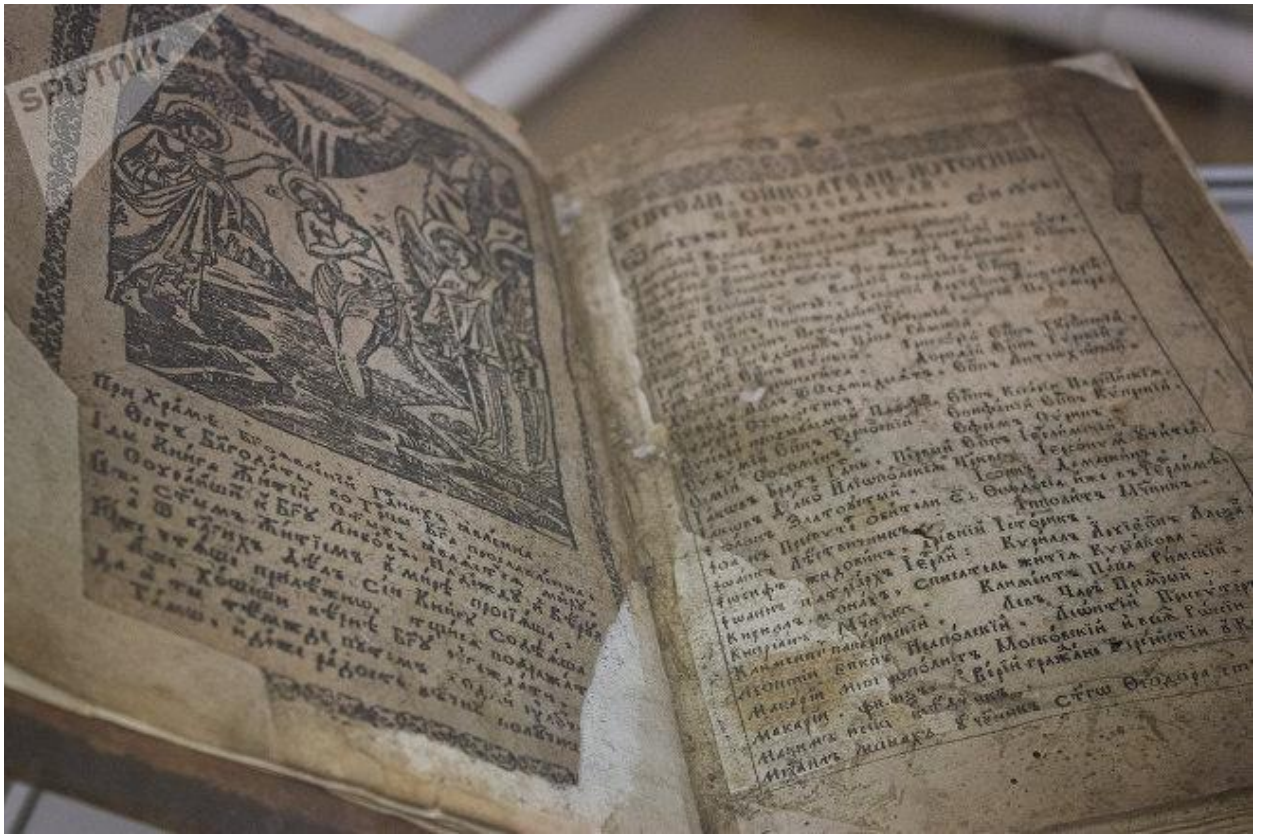
Выданні таго часу ўпрыгожаны шматлікімі гравюрамі

Увогуле, Спірыдон Собаль аказаў значны ўплыў на пашырэнне кнігадрукавання ў Маскоўскай дзяржаве, але пачаў друкаваць кнігі ён у Кіеве, адкуль потым прывёз усё неабходнае абсталяванне ў беларускі Магілёў, на сваю малую радзіму.