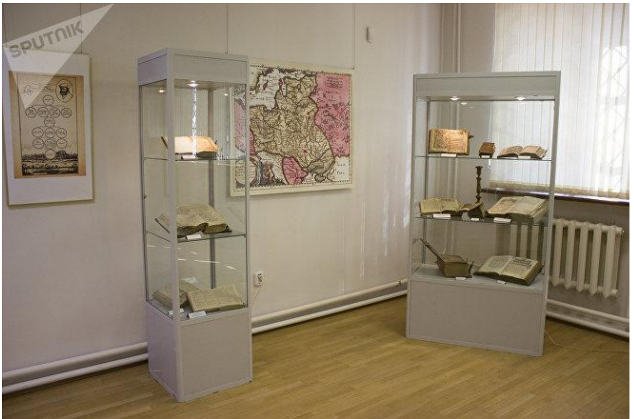
Экспазіцыя выставы невялікая, але вельмі змястоўная

Прадстаўленыя выданні знаёмяць з кнігадрукарскім шляхам Спірыдона Собаля, але самая вядомая праца нашага славутага суайчынніка зараз знаходзіцца на выставе ў Нацыянальнай бібліятэцы.