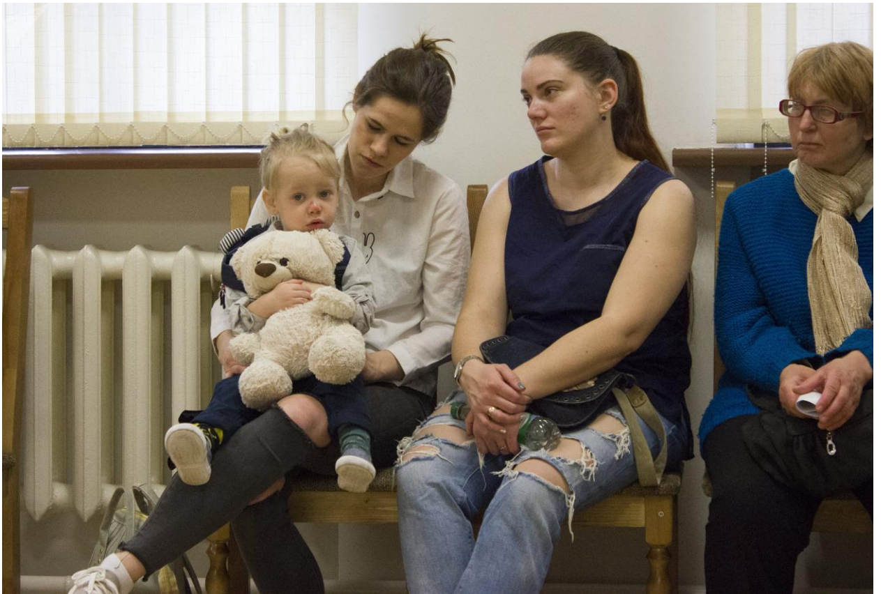
Любоў да роднай культуры - з дзяцінства

Гэтую думку падтрымлівае і намеснік дырэктара Нацыянальнай бібліятэкі Алесь Суша. Па яго словах, зараз беларусы пачалі нанова адкрываць сваю гісторыю, і гэта з'яўляецца працэсам нацыянальнага самавыхавання. Вельмі важна ведаць культурную спадчыну, якая засталася з часоў, у якія жыў і працаваў Спірыдон Собаль.