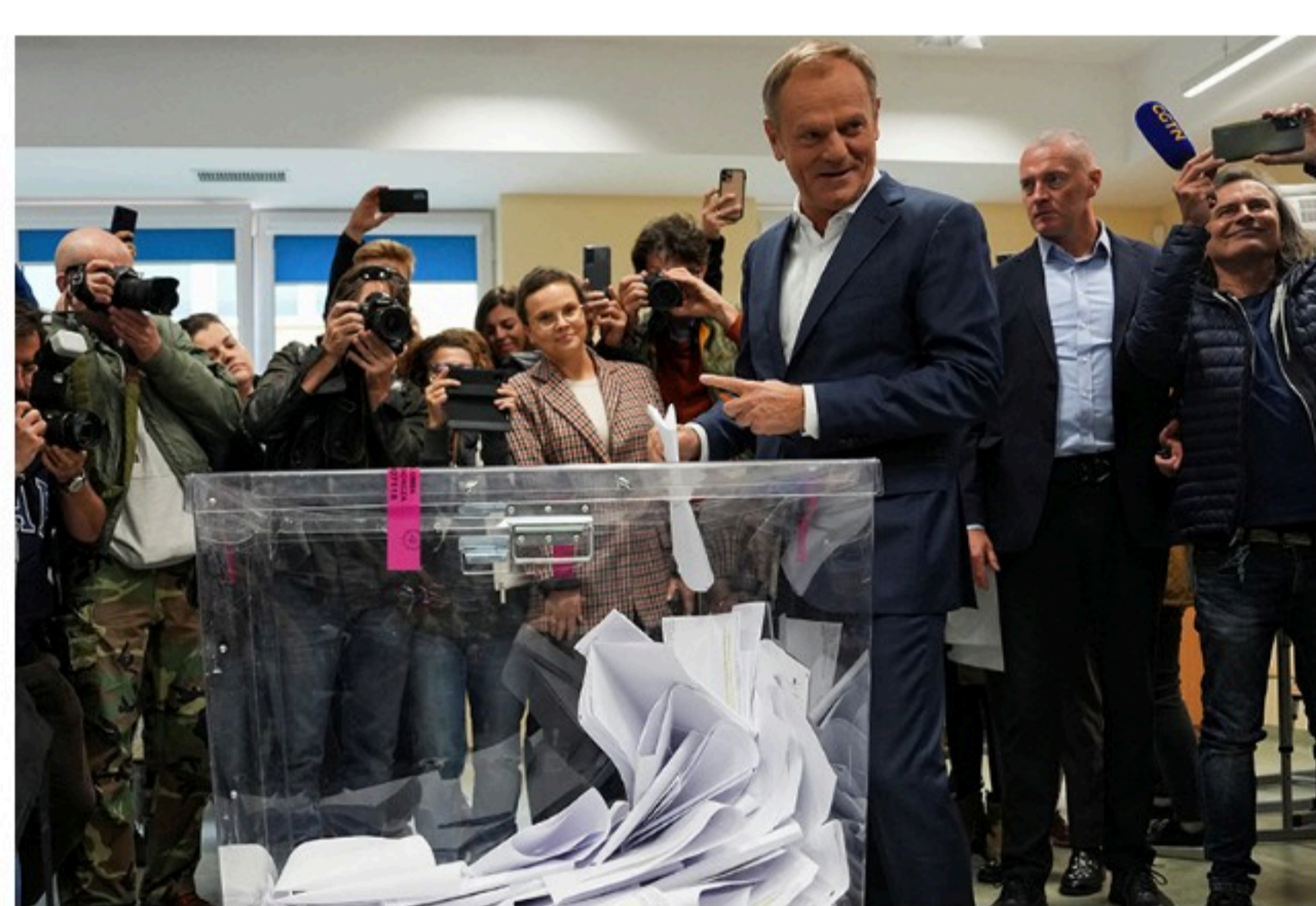
Дональд Туск на избирательном участке.

Что же мы видим сейчас? Партии, сражающиеся за места в парламенте, до одури спорят, чуть ли не дерутся по самым второстепенным и незначительным вопросам. А вот по вопросам войны и мира, позиции Польши на международной арене, решению экономических задач серьезной дискуссии так и не получилось. Да и откуда ей взяться? Ведь любой даже намек на мирное урегулирование украинского кризиса или же налаживание добрососедских отношений с Беларусью и Россией тут же вызовет обвинения чуть ли не в измене Родине.