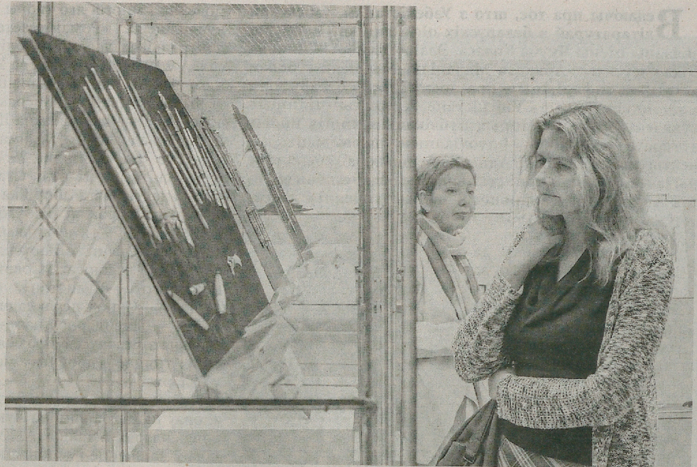
Пісьмовыя прылады вышэйшых слаёў грамадства.

як пісаў Оскар Уайльд у сваім рамане «Партрэт Дарыяна Грэя», прыгажосць у вачах таго, хто глядзіць, і калі чалавек захоча зрабіць са сваёй штодзённасці нешта прыгожае, то знойдзе спосаб. І, як дэманструе выстаўка, беларусы сапраўды знаходзілі мноства такіх спосабаў.