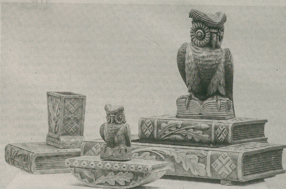
Драўляныя пісьмовыя прылады з анімалістычнымі матывамі.

Выстаўка «Тайны канцылярыі» прымушае сучасніка спыніцца, рассунуць шторы бесперапынных патокаў інфармацыі, падобных на тыя, што мы ўбачылі ў фільме «Матрыца» дзякуючы працы дызайнера Саймана Уайтлі, і паглядзець у акно. Тады наведвальнік здолее ўбачыць увесь велізарны шлях, што прайшлі тэхнікі пісьменнасці на тэрыторыі нашай краіны. Вядома, прылады для пісьма з каменнага стагоддзя на выстаўцы не прадстаўлены, што нядзіўна, бо іх захавалася даволі мала (да таго ж нельга забываць: вялікая частка экспанатаў — гэта асабістая калекцыя Уладзіміра Ліхадзедава, а знайсці настолькі старажытныя экспанаты нават для такога буйнога калекцыянера — справа няпростая), але вось пра тое, чым пісалі ў ВКЛ, дзякуючы экспазіцыі, даведацца можам. Выстаўка выдатна спраўляецца з дзвюма асноўнымі задачамі, якія пазначыў Алесь Суша, намеснік генеральнага дырэктара Нацыянальнай бібліятэкі Беларусі — дырэктар па навуковай рабоце і выдавецкай дзейнасці: