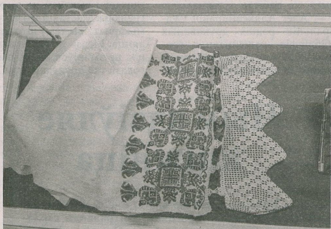
Ручнік, вышыты траюраднай сястрой Максіма Багдановіча.