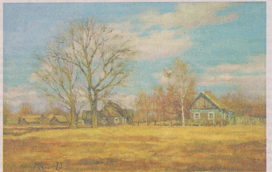
Міхаіл Крот «Вясна на старой вуліцы», 2020 г.

Амаль фатаграфічным і поўным розных адценняў атрымаўся «Сапраўдны захад сонца» (2021) Інгі Карашкевіч. Здавалася б, «правільны», стрыманы, гарманічны кампазіцыйна пейзаж без асаблівых дэталю і акцэнтаў... Аднак ён здольны пазмагацца за ўвагу гледача: колерам, святлом і, галоўнае, настроём.