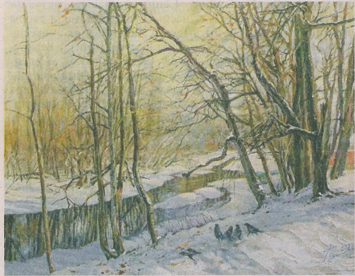
Леанід Вялічка «Зіма ў старым парку», 2022 г.

Увогуле, мастакі не баяцца «сутыкацца з цемрай», адлюстроўваючы змрок: начныя краявіды, выявы прыроды ў час змяркання ці непогоды. Так, даволі таямнічай выглядае работа «Танга» (2020) Ірыны Данскавай, на якой — лес у незвычайным святле. Галоўныя героі — два старыя і ўжо трухлявыя дрэвы, якія перапляліся ў танцы, што не можа не сімвалізаваць шчаслівы саюз, пазачасавы і непарушны. Акварэль у гэтым выпадку стварае атмасфера ўмоўнасці, казачнасці, чаму спрыяюць і ключавыя колеры: чорны і белы, чырвоны і сіні (гэткі ж матыў уласцівы іншай рабоце аўтара пад назвай «Тодэс», 2020). Падобная па настроі графіка Кацярыны Мясніковай («Уражанні-2», 2021; «Сезон дажджоў і туманаў», 2021), якая робіць акцэнт на паўсядзённым, звычайным, аднак імкнецца паказаць яго незаўважную ўнікальнасць. У творах адсутнічаюць па-сапраўднаму адметныя дэталі, іх разыначка — агульныя планы, у якіх можна згубіцца, растаць. Вельмі экспрэсіўны і жывы лінарыт Марыны Дарожкі «Саборная плошча. Мінск» (2020), адзін з нямногіх на выстаўцы гарадскіх пейзажаў. Нягледзячы на моцны ўпор на архітэктурную прыгажосць гэтай часткі Мінска, некалькі прыкмет даюць зразумець, што перад гледачом не старажытны горад ці сталіца перад ваенным разбурэннем. Ён сучасны, багаты, светлы,