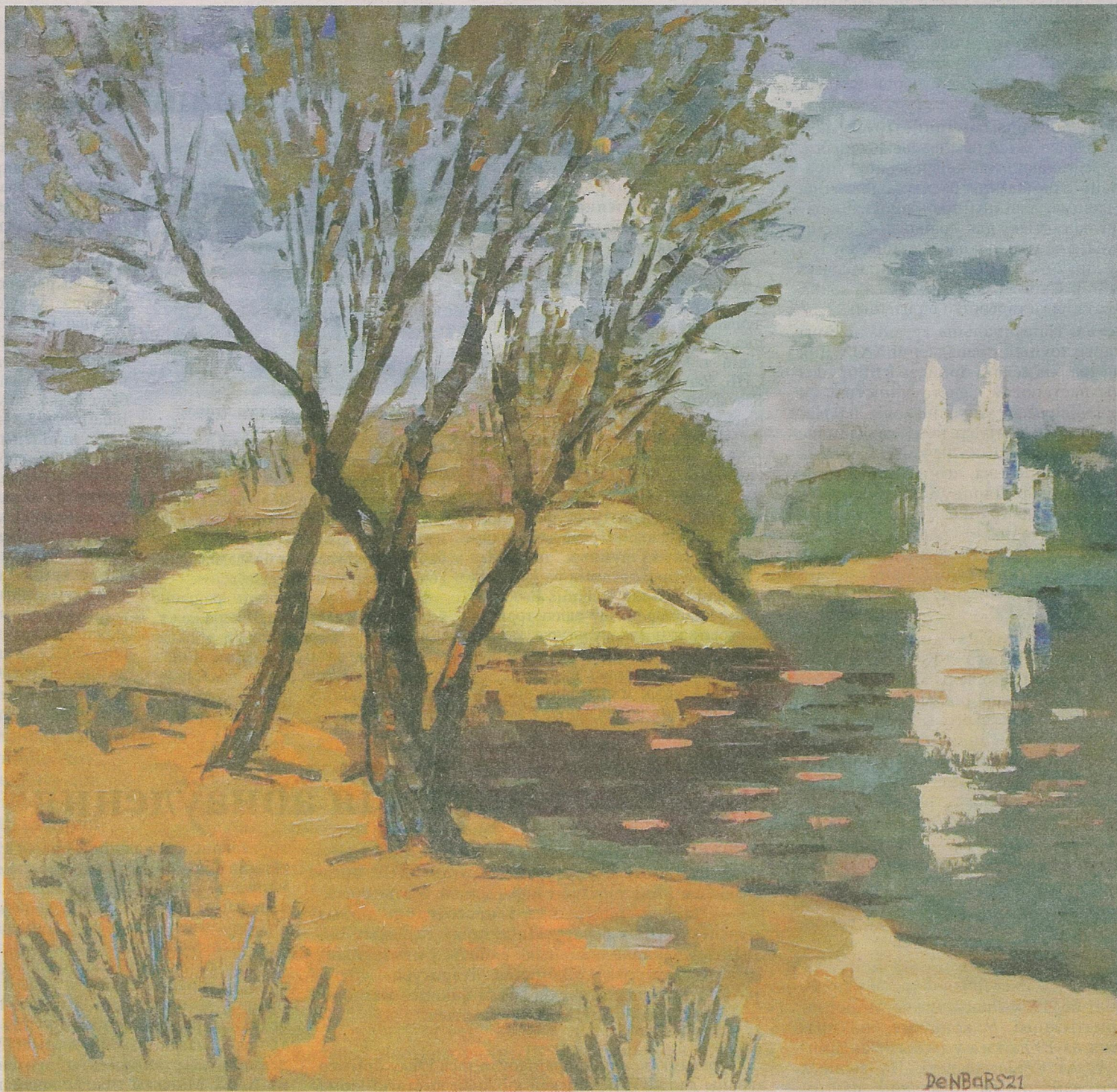
Дзяніс Барсукоў «Ранняя вясна ў Полацку», 2021 г.

Ці можна падлічыць і неўзабаве адказаць на пытанне, якую пару года мастакі на працягу стагоддзяў адлюстроўвалі часцей, хаця б што тычыцца выключна жанру пейзажа? Натуральна, гэта немагчыма нават пры вялікім жаданні, аднак у межах адной краіны можна зрабіць спробу аналізу на такую тэму. У любым выпадку вясна, якую нарэшце нам паказвае каляндар, — распаўсюджаны і любімы жывапісцамі сюжэт. Чаканая, багатая на святло і фарбы, яна радуе абуджаннем прыроды і спевамі птушак, якія, што дзіўна, таленавіты мастак здольны перанесці на палатно.