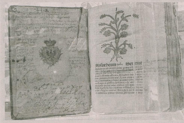
Гербарый. Майнц, 1484 г.

У тэксце — гравюра з выявай Амвросія Медыяланскага. Аўтарам яе, лічыцца, мог быць Дзюрэр альбо вучні яго школы. Упрыгожвае вітрыну і ўнікальны асобнік «Боскай камедыі» Дантэ Аліг'еры, надрукаваны ў 1481 годзе ў Фларэнцыі, родным горадзе аўтара. У асобніку — некалькі гравіраваных выяў — работы Сандра Бацічэлі, гэта адно з першых прымяненняў адбіткаў медных пласцін. Медыярыты ўвойдуць у друкарскую практыку толькі ў XVI стагоддзі.