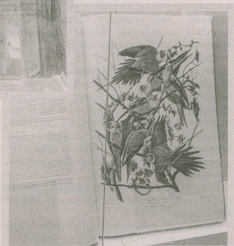
«Птушкі Амерыкі» Джэймса Адзюбона, факсімільнае выданне 1972 г.

Адмысловыя выданні, побач з якімі можна доўга стаць, уяўляючы постаць нашага першадрукара, — скарынаўскія палеаграфічныя. Нацыянальная бібліятэка Беларусі — адзіная ў краіне захавальніца 10 асобнікаў, выдадзеных у Празе. Арыгінал з добра чытальным тэкстам на паперы выдатнай якасці, у тэксце — прабелы паміж словамі, максімальна прыбраны