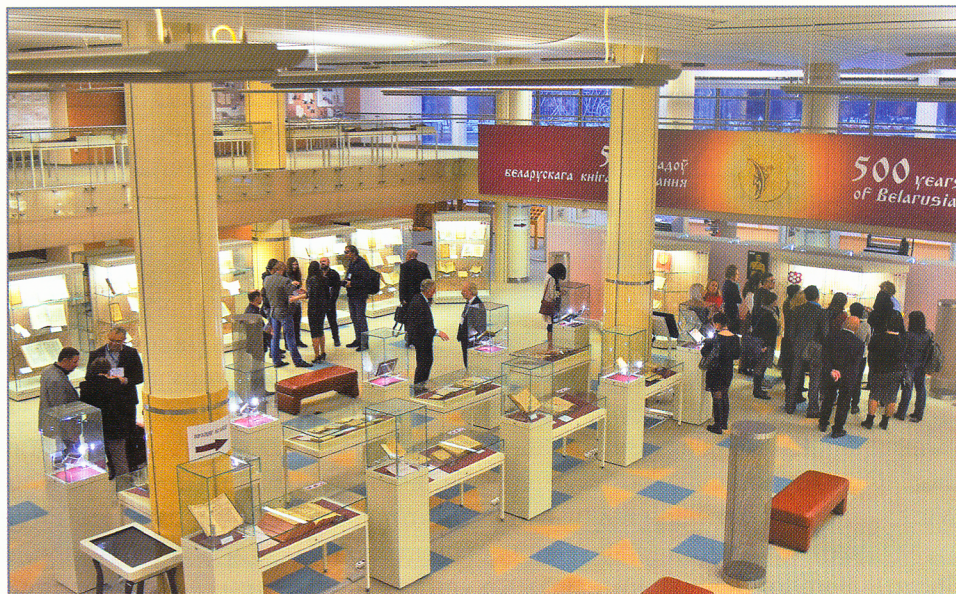
Многофункциональный выставочный комплекс

Наиболее сложно с позиций экономической эффективности осуществляется работа физкультурно-оздоровительного комплекса. Сауна и тренажерный зал в условиях растущей конкуренции теряют постоянных посетителей и не выходят в последние годы на самоокупаемость.