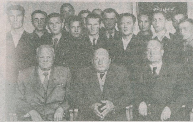
Гурбуноў, Я. Колас і П. Броўна сярод маладых пісьменнікаў. «Літаратура і мастацтва», 1955

Пра ўшанаванне і выданне спадчыны Зінаіды Бандарынай, якая належала да маладнякоўцаў, распавядала Аксана Данільчык. Выдадзеная «Бліскавіцы.