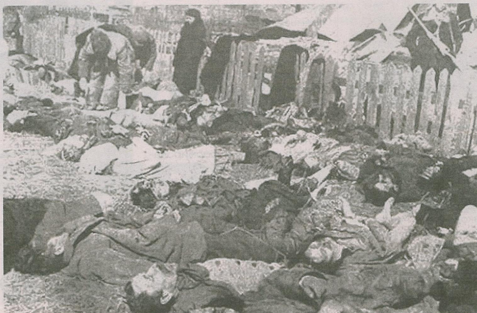
Убитые жители села Липники Костопольского района Волыни. 26 марта 1943 г. банды УПА расстреляли здесь 182 человека.

17—21 февраля 1943-го в местечке Олеско, что на Львовщине, состоялась III конференция ОУН, которая провозгласила начало «национального восстания». Правда, проходило оно в странной форме — в основном в виде