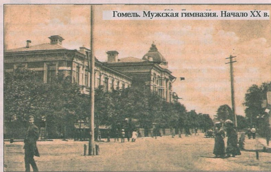
Гомель. Мужская гимназия. Начало XX в.