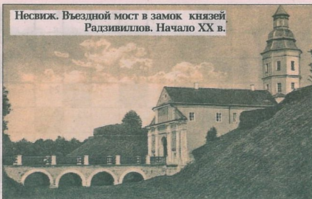
Несвиж. Въездной мост в замок князей Радзивиллов. Начало XX в.