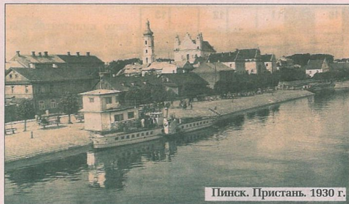
Пинск. Пристань. 1930 г.