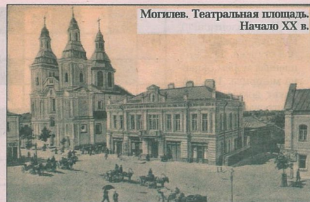
Могилев. Театральная площадь. Начало XX в.