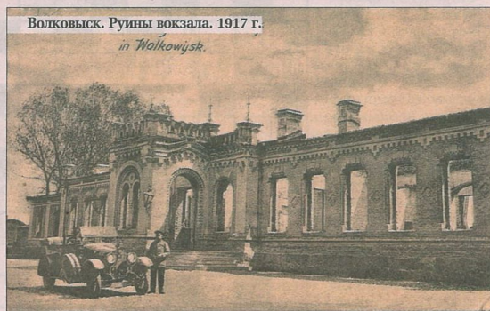
Волковыск. Руины вокзала. 1917 г. in Volkovysk.