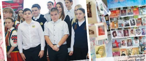
Падчас адкрыцця перасоўнай кніжнай выставы ў вёсцы Ліхавічы Іванаўскага раёна