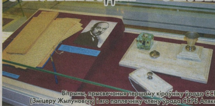
Вітрыны, прысвечаныя першаму кіраўніку ўрада ССРБ Цішку Гартнаму (Зміцеру Жылуновічу) і яго папличніку члену ўрада ССРБ Аляксандру Чарвякову.