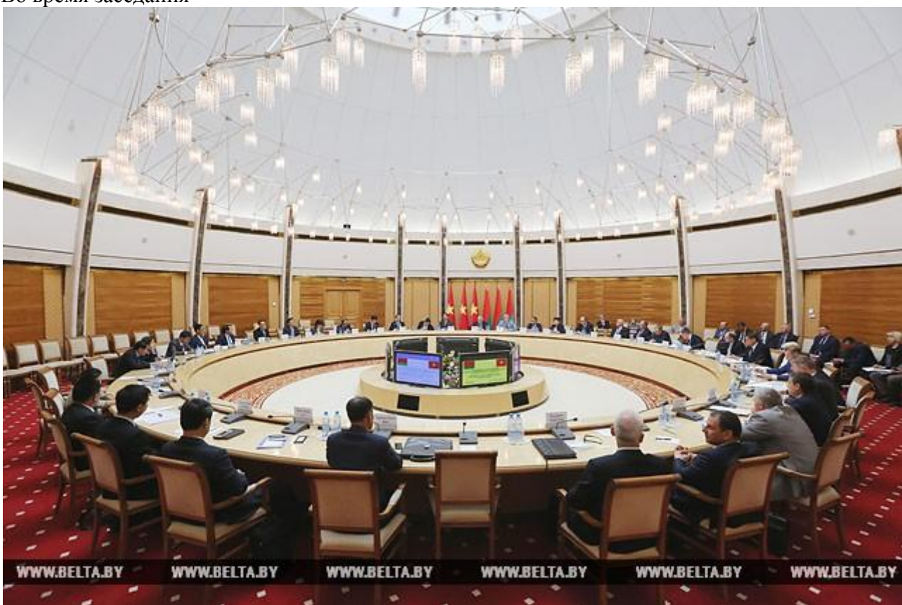
Во время заседания

Во Вьетнаме строится завод "МАЗ-Азия", первую очередь которого планируется ввести в эксплуатацию в сентябре. "На уровне вьетнамского правительства принято окончательное решение о предоставлении совместному предприятию по сборке автомобилей МАЗ