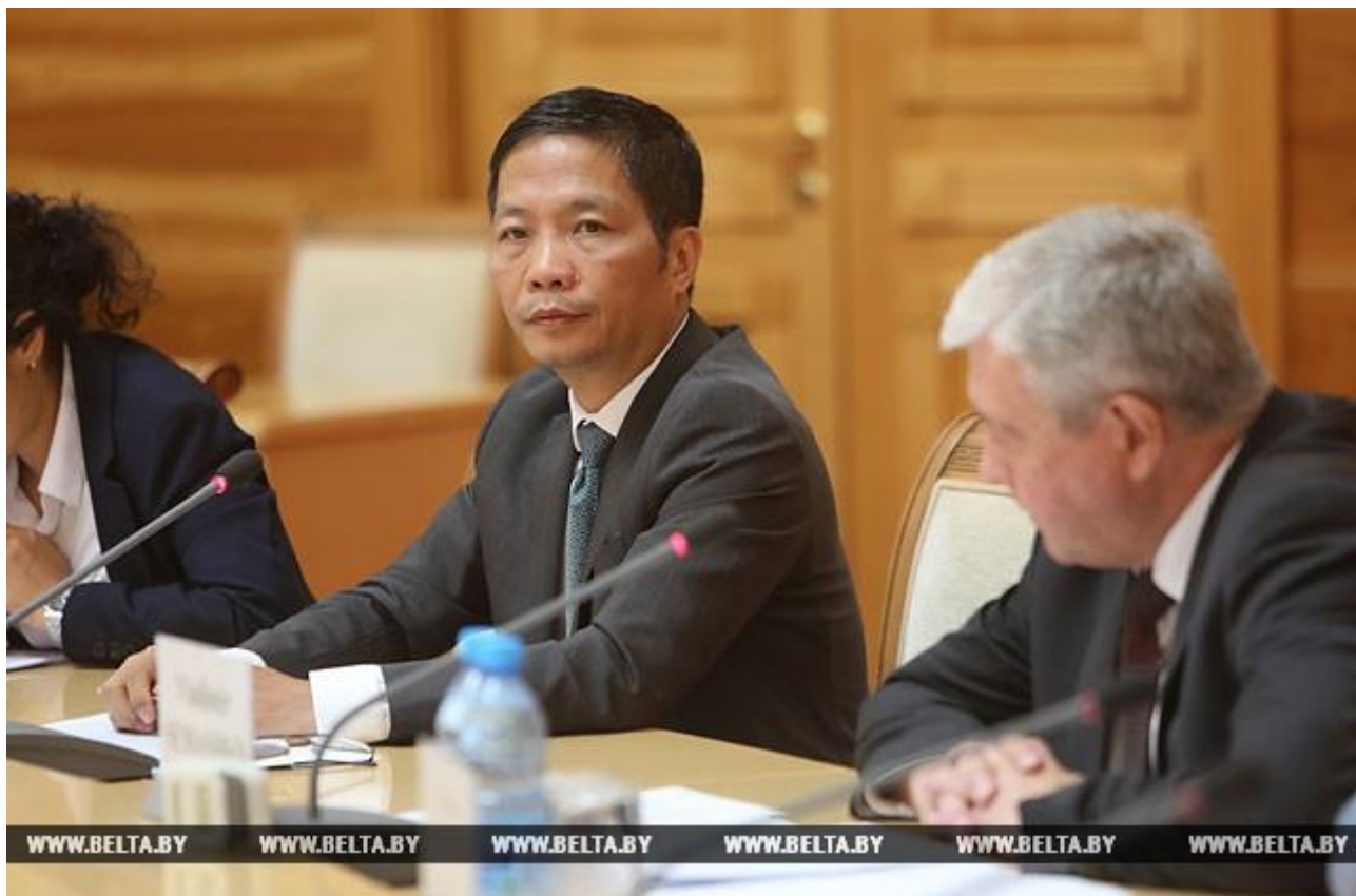
Министр промышленности и торговли Социалистической Республики Вьетнам Чан Туан Ань

адаптационного периода сроком 18 месяцев к новому законодательству. Это позволит СП работать в абсолютном соответствии с законодательством Вьетнама. Думаю, что оно будет работать успешно", - отметил вице-премьер.