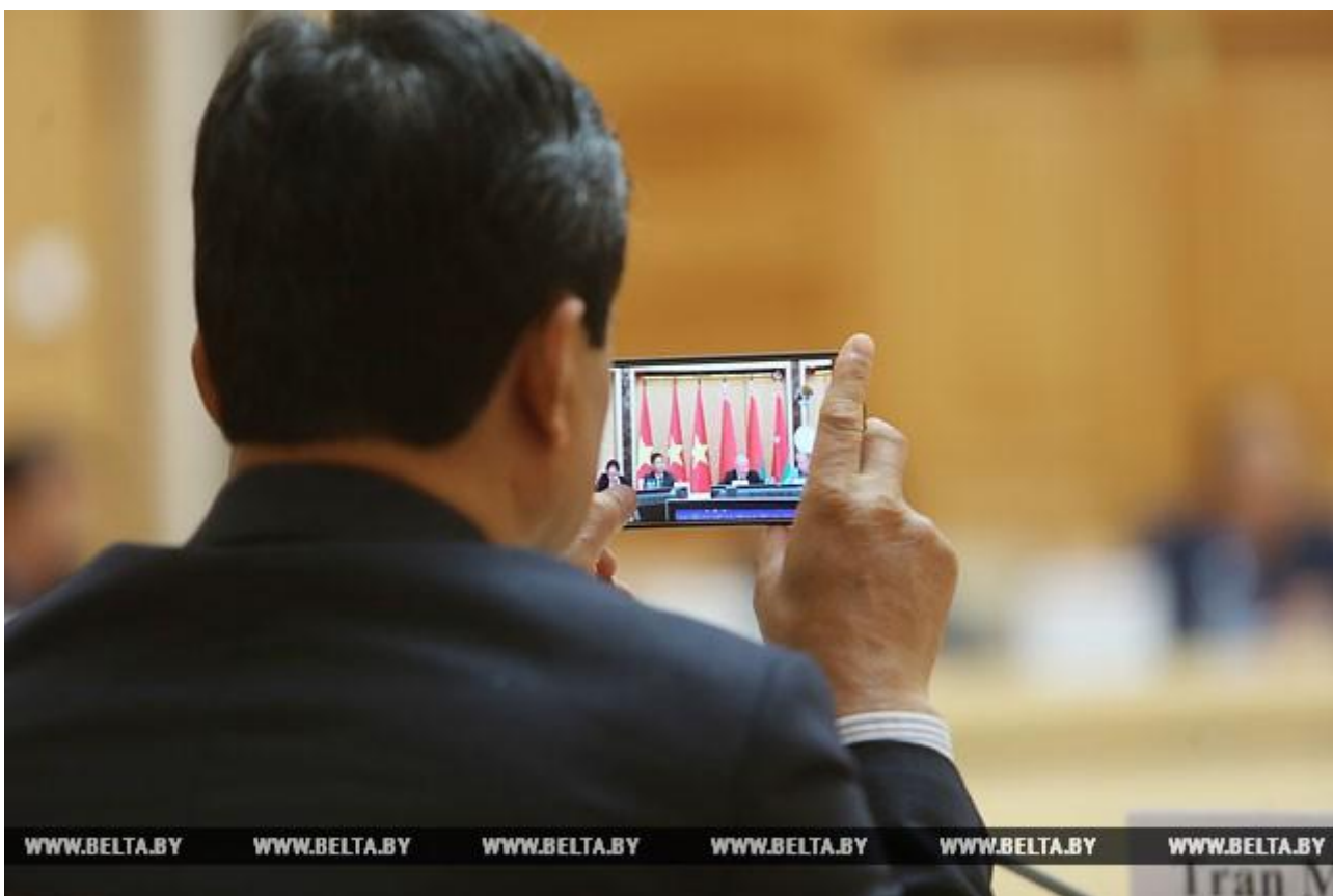
Во время заседания