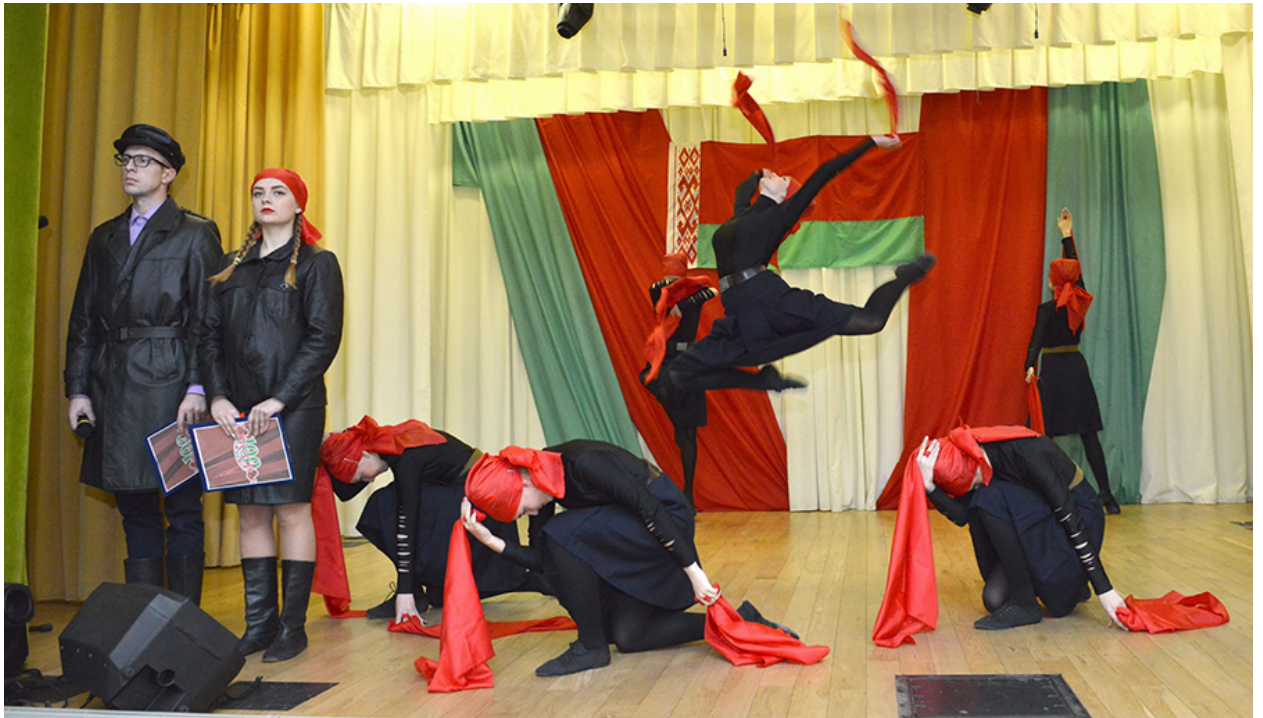
Торжественное мероприятие «Няхай імя тваё свяціцца, Беларусь» в агрогородке Путришки.