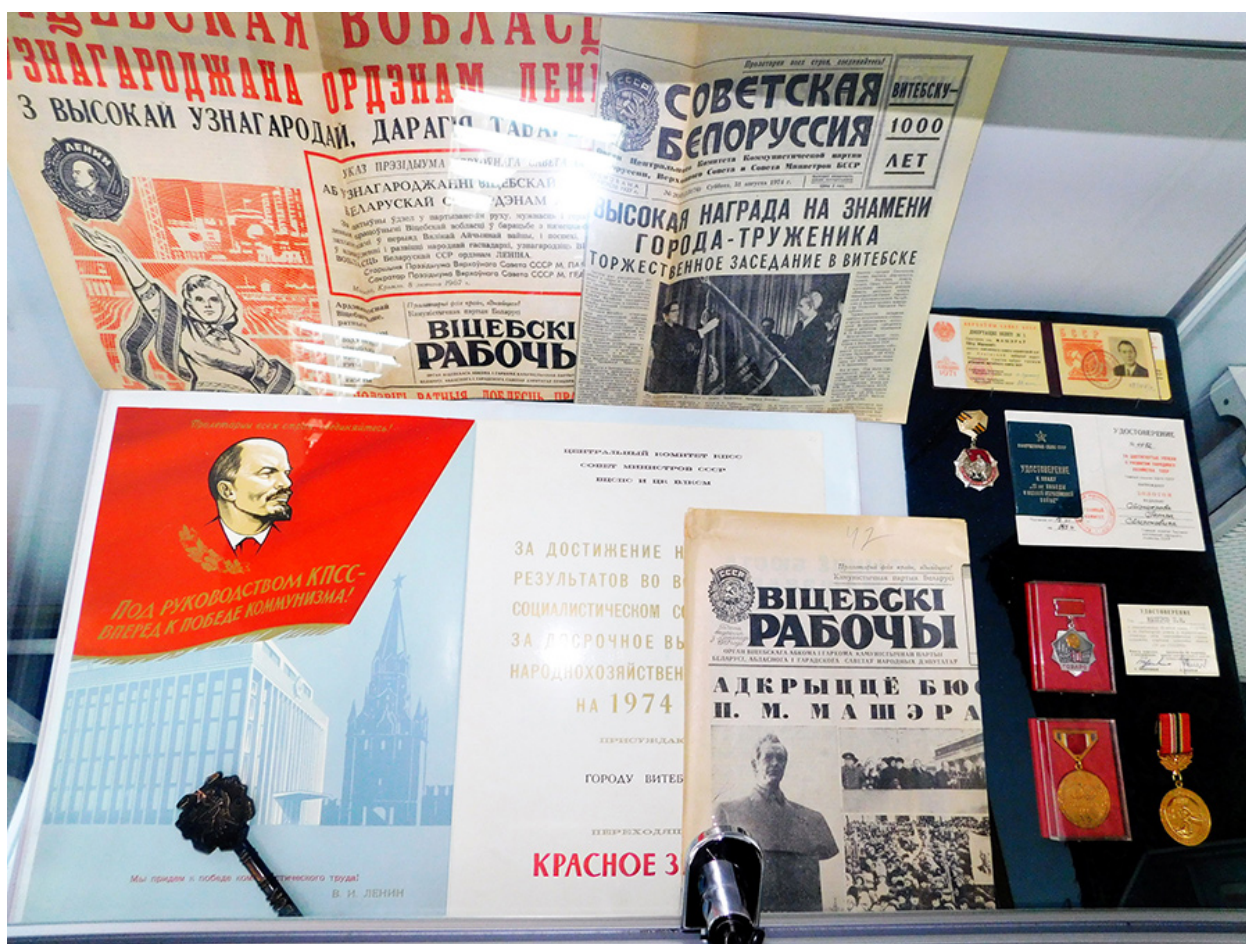
Выставка к юбилею в областном краеведческом музее.

— Жители области внесли свой вклад в развитие Беларуси на всех непростых этапах бурного XX столетия. На фотографиях посетители могут увидеть, как выглядел город в разные времена, познакомиться с историей предприятий, которые были брендами области в прошлом, и с современными флагманами. Например, представлен символический миллиардный метр Оршанского льнокомбината 1980 года, подарок к 30-летию БССР от коврового завода и многое другое.