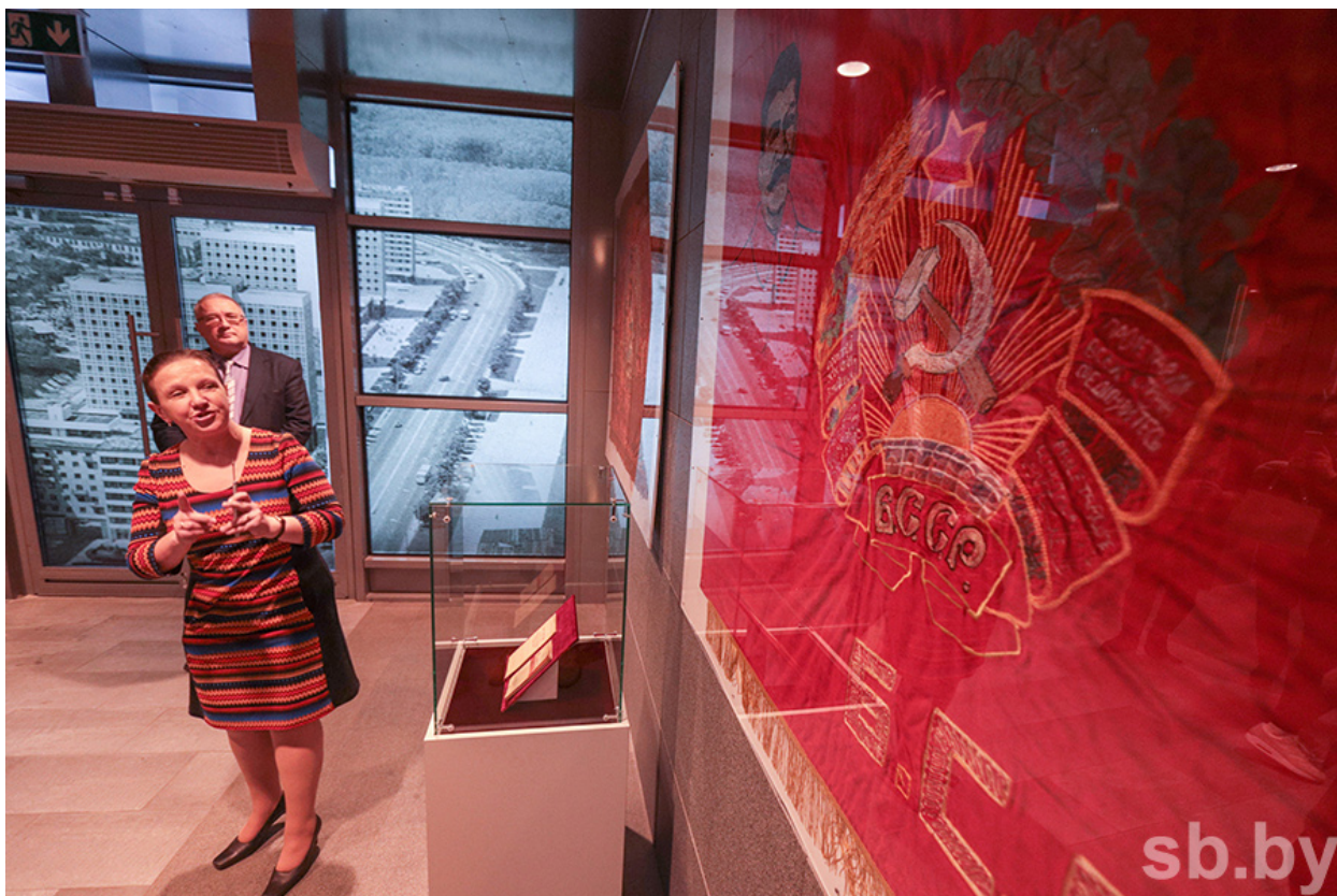
Открытие экспозиции к 100–летию БССР в музее истории ВОВ.