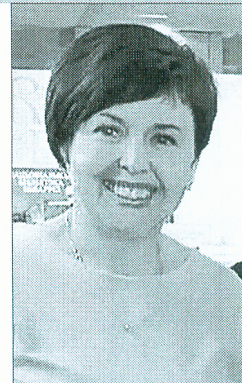
Первый заместитель генерального директора Национальной библиотеки Беларуси