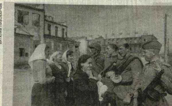
В освобожденном Витебске. Бойцы беседуют с жителями города. Белорусская ССР, июнь 1944 г.