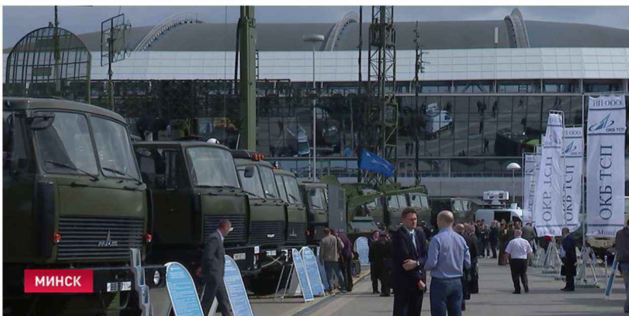
В МИНСКЕ ПРОХОДИТ МЕЖДУНАРОДНАЯ ВЫСТАВКА ВООРУЖЕНИЯ «MILEX-2