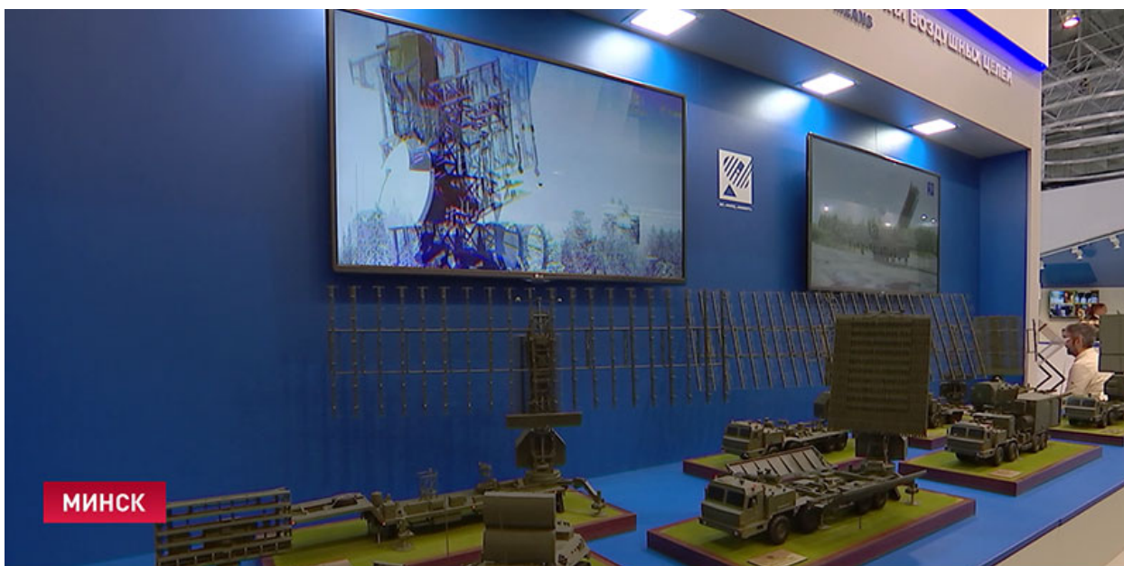
В МИНСКЕ ПРОХОДИТ МЕЖДУНАРОДНАЯ ВЫСТАВКА ВООРУЖЕНИЯ «MILEX-2015»