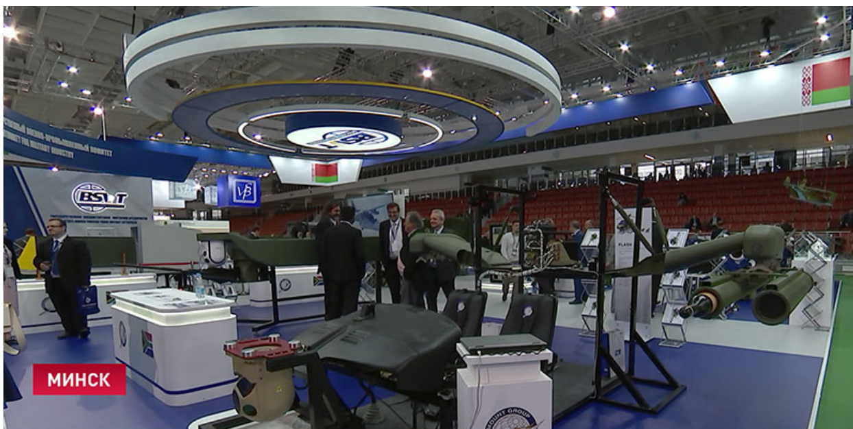
В МИНСКЕ ПРОХОДИТ МЕЖДУНАРОДНАЯ ВЫСТАВКА ВООРУЖЕНИЯ «MILEX-2015»