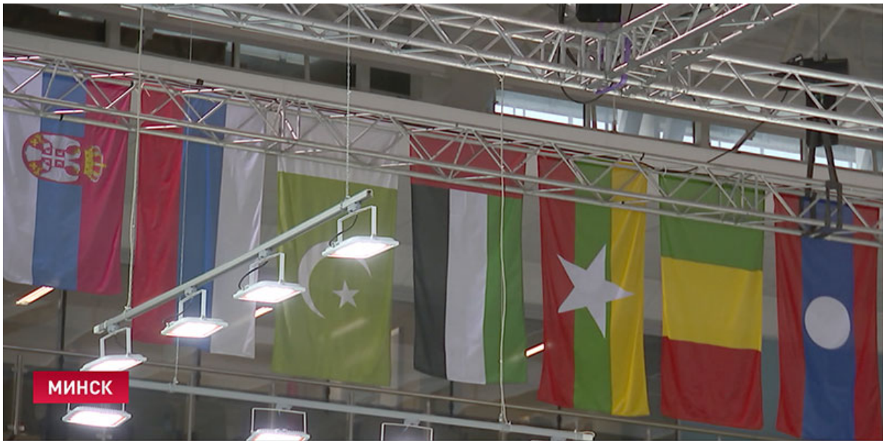
В МИНСКЕ ПРОХОДИТ МЕЖДУНАРОДНАЯ ВЫСТАВКА ВООРУЖЕНИЯ «MILEX-2017»