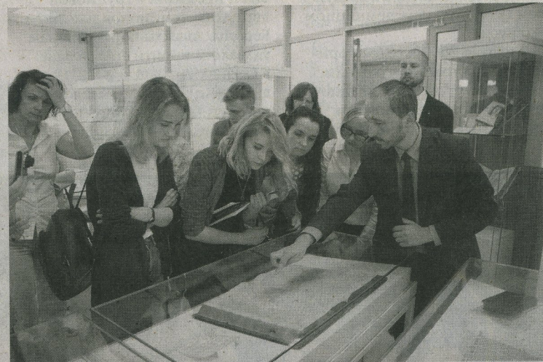
▲ Книги на все времена всегда вызывают неподдельный интерес.