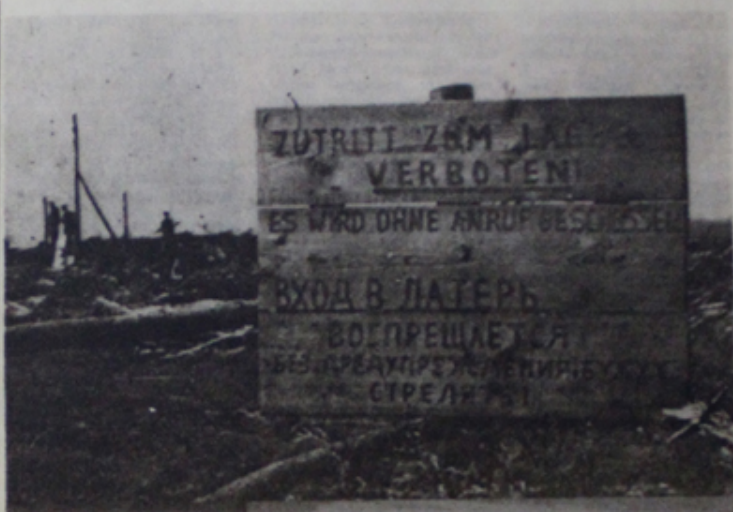
Боль і смутак — «Трасцянец»

Захадом па увекавечанні памяці ахвяр «Трасцянец» была прынята ў вывадзі-ахоўны перыяд, не могуць задаволяць грамадства. З аднаго боку, мемарыял у вяс. Дзюдам па 9-м км Мяскоўскай і іншыя ўзведзены за межамі былага лагера смерці і месцаў пакавання яго ахвяр. З другога боку, частка тэрыторыі лагера і месца дэпартацыі тысяч людзей не ўключаны ў склад зоны ахоўнай помніка гісторыі. На гэтых месцах па-варварску вядома гаспадарыць дзейнасць знішчальнага магліна, з'яўляюцца насцяжэнні і г.д. Складаным не вострым спар.