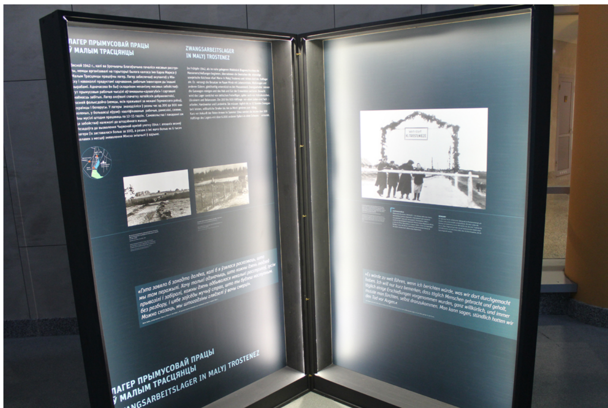
Стенд, посвященный лагерю принудительного труда в Малом Тростенце