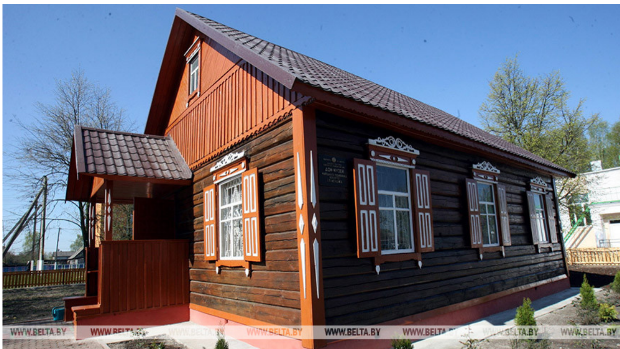
Музей Ивана Мележа в деревне Глинище. 2008 год

В школьные годы он увлеченно и много рисовал, мечтая стать художником. Охотно участвовал в драматическом кружке, выступал в школьных спектаклях. Много читал, пробовал писать стихи.