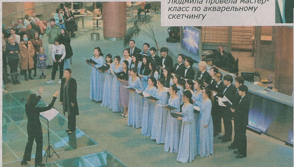
Желающих послушать выступление хора китайских студентов БГПУ было много