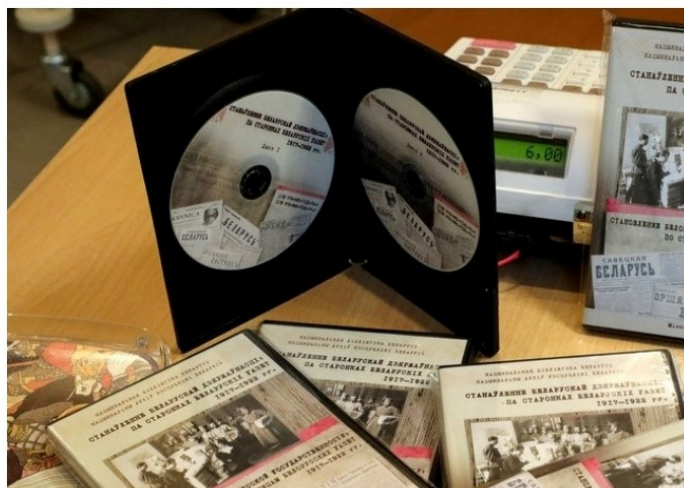
Диски с материалами о становлении белорусской государственности.

Редкие издания для этого архива пришлось собирать, что называется, всем миром. На дисках представлены газеты, которые представляют научный интерес для исследователей, историков, архивистов, краеведов и политологов, сообщает портал « Беларусь сегодня ».