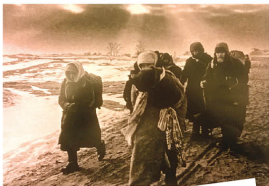
Вяртанне з лагера.