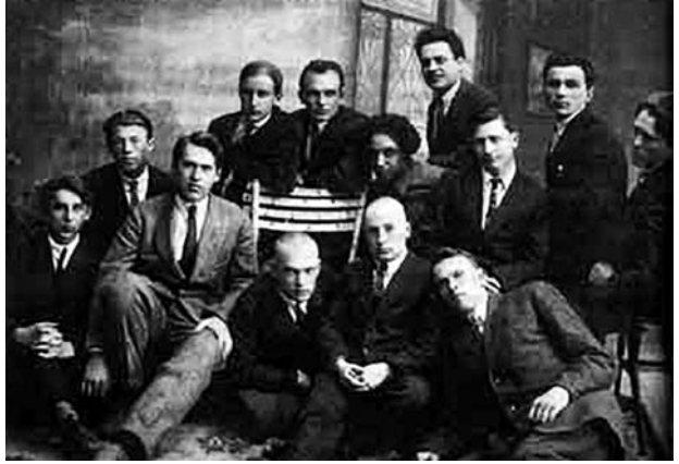
«Узвышша». 1928 год.