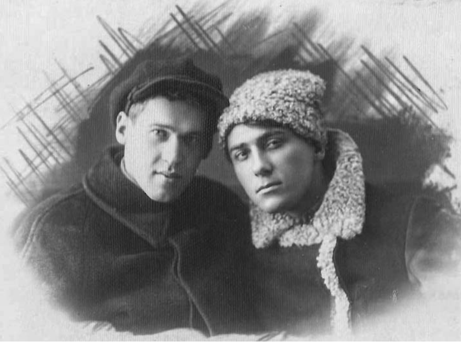
Дубоўка і ўкраінскі паэт Уладзімір Сасюра. 1925 год.

У 1924-м Дубоўка ўпершыню трапляе ў Мінск. Камандзіроўка найперш службовая: яму дадзена заданне наладзіць у БССР выпуск часопісаў — дзіцячага і настаўніцкага. Тыя часопісы, запачаткаваныя Дубоўкам, жывыя і сёння: «Беларускі піянер», што стаў «Бязрозкай», і «Асвета». Але не часопісы тут галоўнае. Галоўнае, што нарэшце паэт знаёміцца са сваім чытачом.