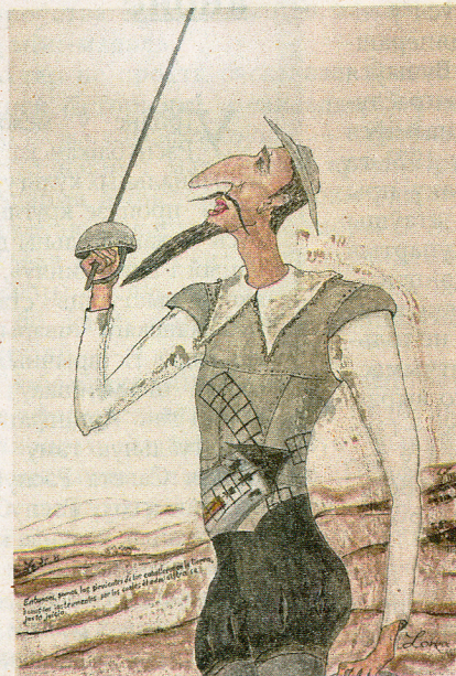
Ларыса Клімава «Дон Кіхот Ламанчскі», 2019 г.