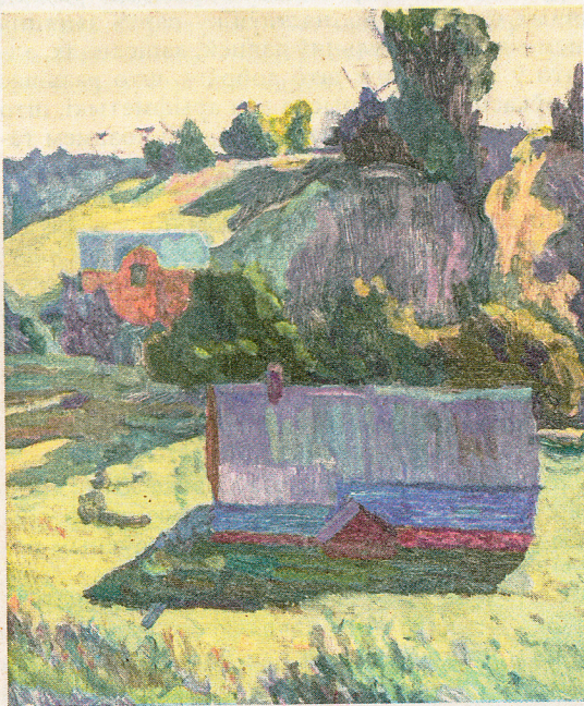
Дзмітрый Пятроўскі «Сонца прыгрэла. Чэрвень», 2017 г.

Яшчэ адна бібліятэчная пляцоўка для выставачных праектаў — «VILNIUS». Мастацкая галерэя, якая знаходзіцца ў мінскай бібліятэцы № 18, днямі адзначыла дзень нараджэння — 25 гадоў. З гэтай нагоды прадстаўнікі кніжніцы запрасілі аматараў мастацтва на святочную сустрэчу і адкрылі выстаўку жывапісу «Нам 25!»