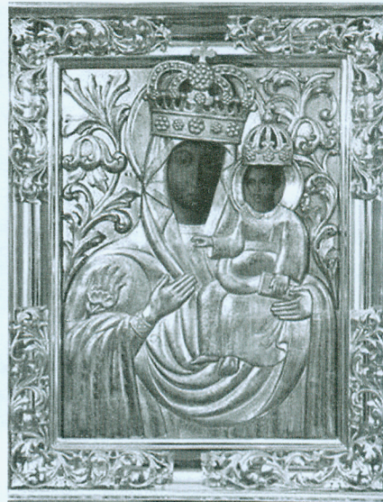
Цудадзейны абраз Маці Божай Юравіцкай. З краёўскага касцёла (злева і ў цэнтры) спіс абраза, які захоўваецца ў юравіцкай царкве.

самай грушы, на якой з'явіўся цудадзейны абраз Маці Божай Юравіцкай. Груша была распілавана па благаслаўленні ксяндза на кавалкі і падзеленая паміж усімі жыхарамі мястэчка. Кожны такі кавалак быў даўжынёй каля 2 см і таўшчынёй не больш за 0,5 см. Перадаваліся яны ў спадчыну ад пакалення да пакалення. Такі грушавы кавалак быў і ў маёй бабулі Паўліны. І па сённяшні дзень захаваўся гэты прыродны земляны выступ, на якім расла груша, а пазней была пабудавана капліца для Маці Божай. На гэтым месцы былі знойдзены рытуальныя шклянныя чашы, пячныя ізразцы, кавалкі керамічнага посуду і г.д. Усе гэтыя знаходкі цяпер захоўваюцца ў Нацыянальнай Акадэміі навук Рэспублікі Беларусь.