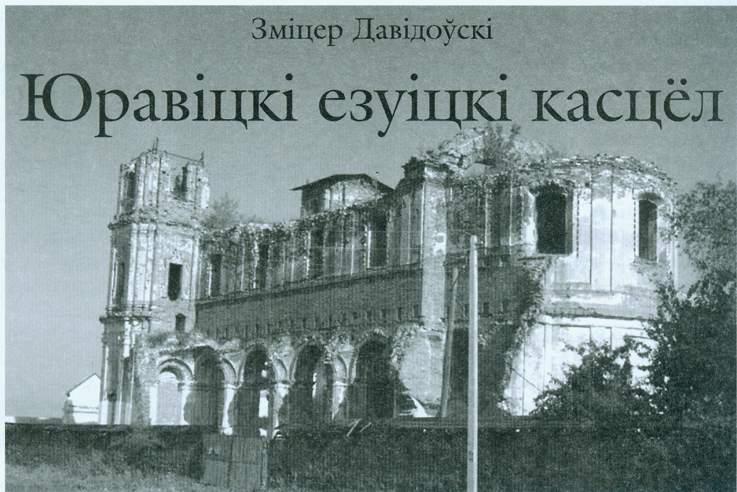
Сённяшні стан юравіцкага касцёла.