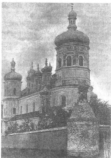
Юравіцкі касцёл, перабудаваны ў праваслаўную царкву. Фота пач. XX ст.

У 2008 г. падчас раскопак археолагі знайшлі рэшткі капліцы, якая знаходзілася над стаянчай першабытнага чалавека (26,5–30 тыс. гадоў да н. э.). Яна была пабудавана на месцы той