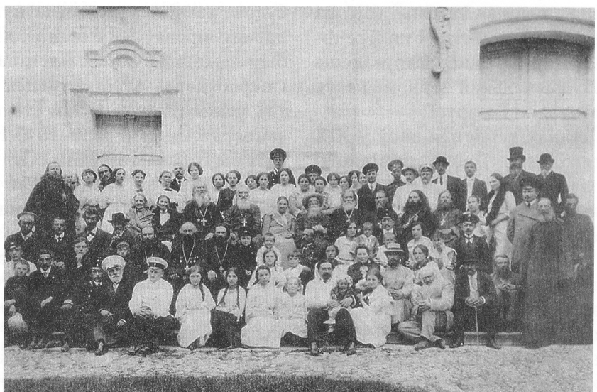
Група святароў і вернікаў перад юравіцкай святыняй. Фота пач. XX ст.