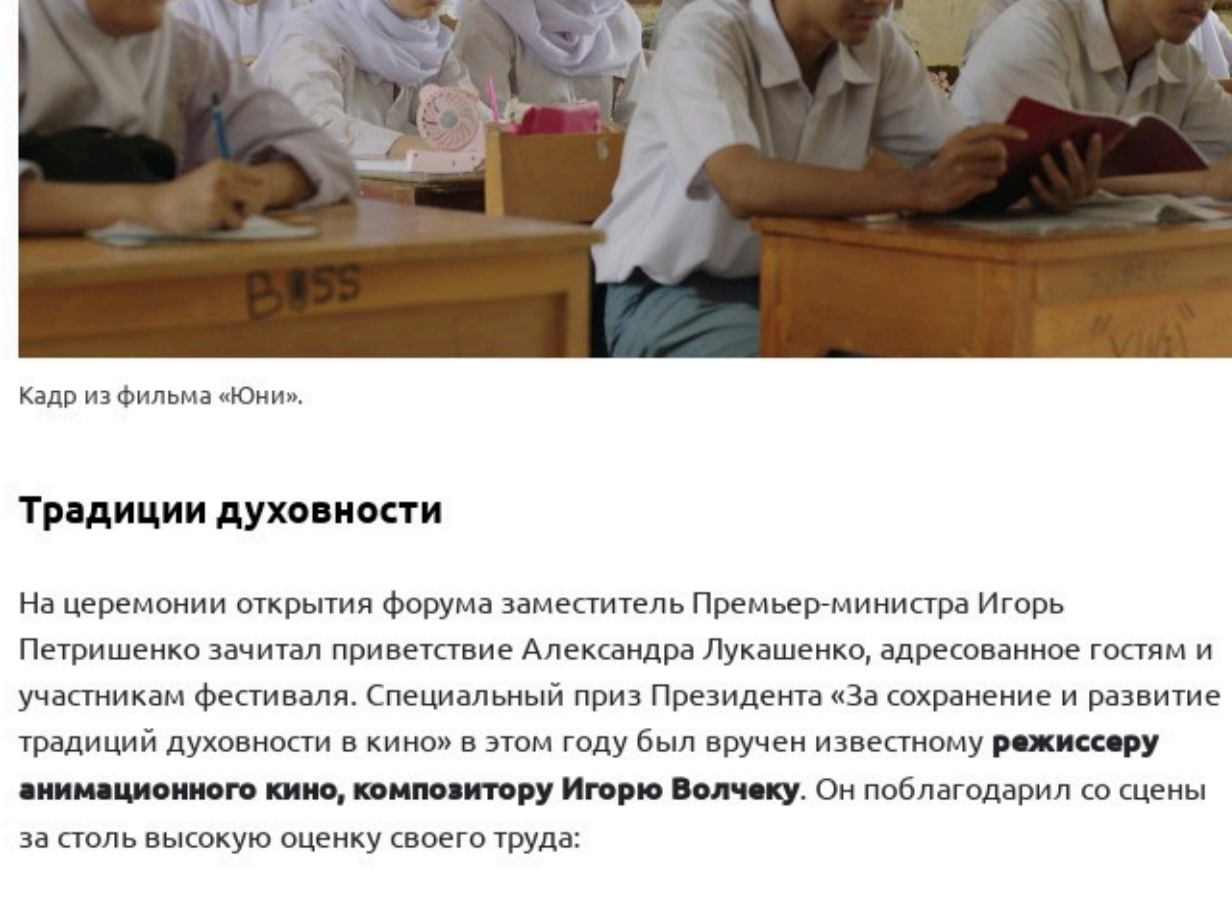
Кадр из фильма «Юни».

Нынешний форум проходил под девизом «Кино — симфония единства». Интересно, кому оказался огромным — пришло более 273 заявок из 54 стран. Видимо, сказались пандемия и отсутствие сильных кинематографических впечатлений, а создатели фильмов не могут жить в вакууме.