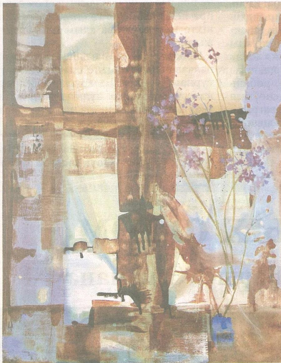
Кацярына Вішнеўская «Хутка вясна», 2011 г.

Традыцыйная выстаўка-віншаванне «Палітра вясны», прымеркаваная да 8 Сакавіка, працуе ў галерэі «Ракурс» Нацыянальнай бібліятэкі Беларусі. Немудрагелістыя нацюрморты і партрэты, знаёмыя кветкавыя кампазіцыі і вясновыя абстракцыі прадставілі больш за 45 сучасных аўтараў. Гэта члены Беларускага саюза мастакоў, Еўразійскай мастацкай садружнасці, арт-студыі «Акварі». Ubачыць работы сталых і юных жывапісцаў, графікаў, акварэлістаў можна да 7 красавіка.