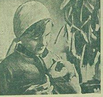
В минском Дворце пионеров много регулярные работы кружки. На снимке: юная пионерница учащая 4 класса 2 школы Шушарского района Минского района работает в кружке.

Кроме того, в парке множество молодых деревьев, посаженных сюда из трудовоспект и совхозов страны.