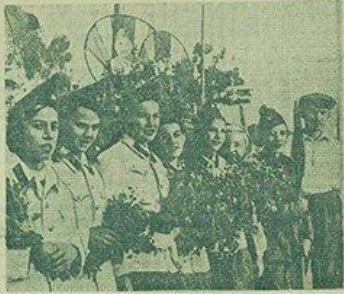
Трудовой г. Говина с цветами в руках идет встретить части родной Красной Армии, возвращающиеся с войны.

Министерство культуры имеет план «Славянка». В опера есть еще несколько номеров. «Славянка».