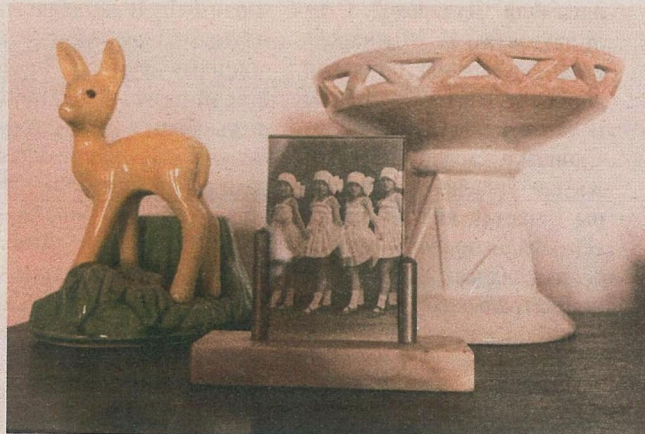
3 экспазіцыі выставы “In zoom”.

Чаму такое злучэнне аказалася магчымым? З камернага асяроддзя, ад хатніх архіваў, аўтар выходзіць у навакольны свет. І вядзе за сабой нас, прапаючы абсалютна арганічны і адкрыты працяг “сваіх гісторый”. Знойдзеныя словы набылі новы аб’ём, новы нарматыў.