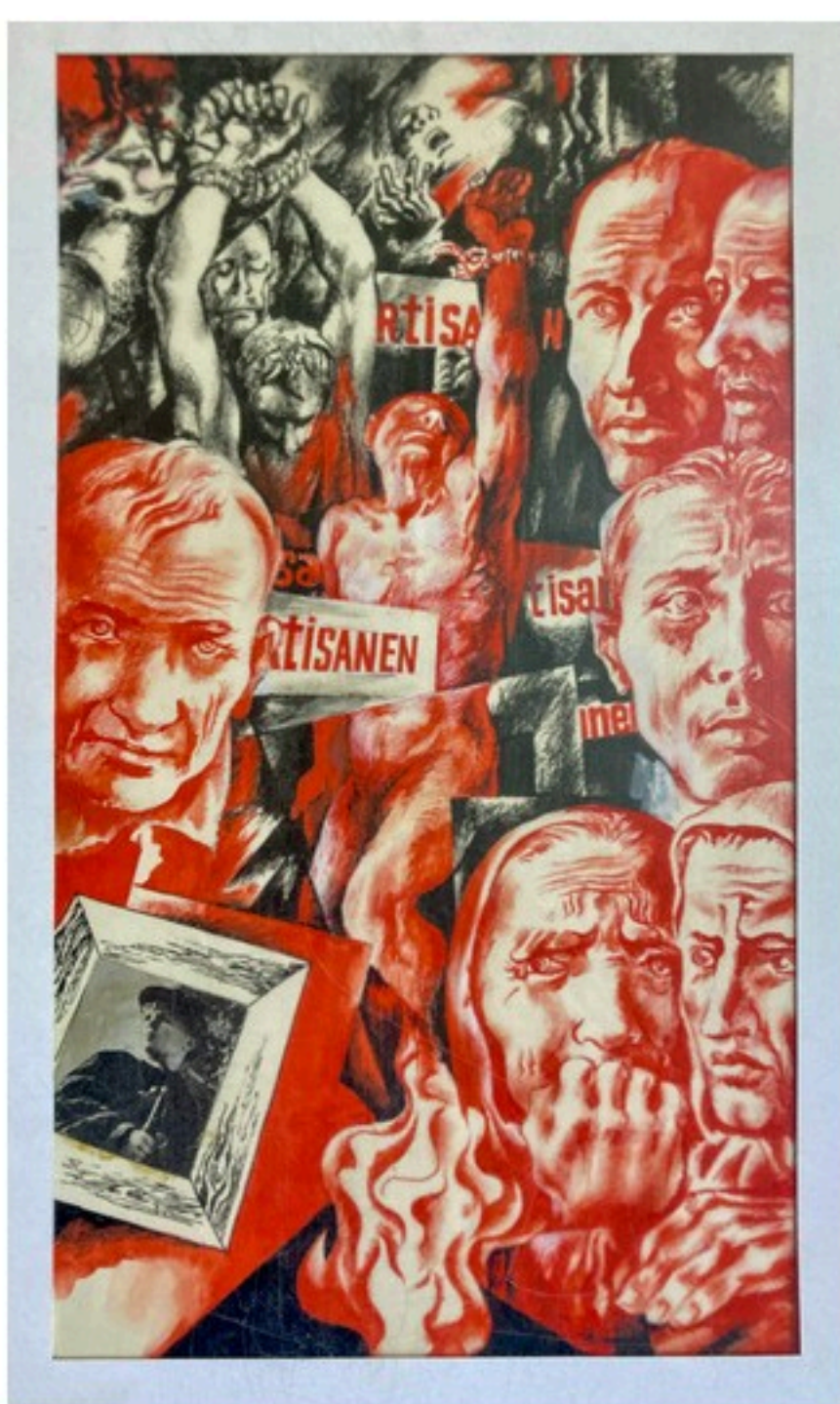
«Сповідзь сэрца» (ілюстрацыя да твора Антона Бялёвіча), 1978 г.

Ілюстрацыя кнігі, асабліва дзіцячая, — удзячная справа. Калі малявальшчык дамогся ўвагі маленькага чытача ці падлетка, добрым словам яго будуць успамінаць усё жыццё. Гэта не перабольшанне: малюнкi, убачаныя ў патрэбны час, пэўным чынам уплываюць на асобу. Шмат пазней мы заўважаем у іншых творах выяўленчага мастацтва знаёмыя матывы, аддаём перавагу характэрным каларыстычным рашэнням ці прыязна ставімся да вядомых сюжэтаў.