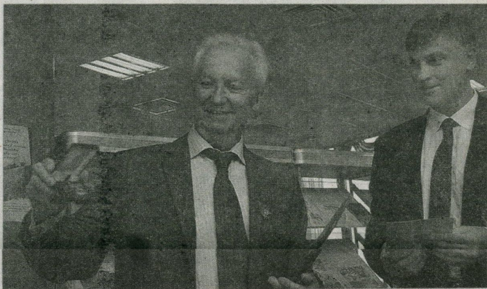
Узнагарода ад Міністэрства інфармацыі