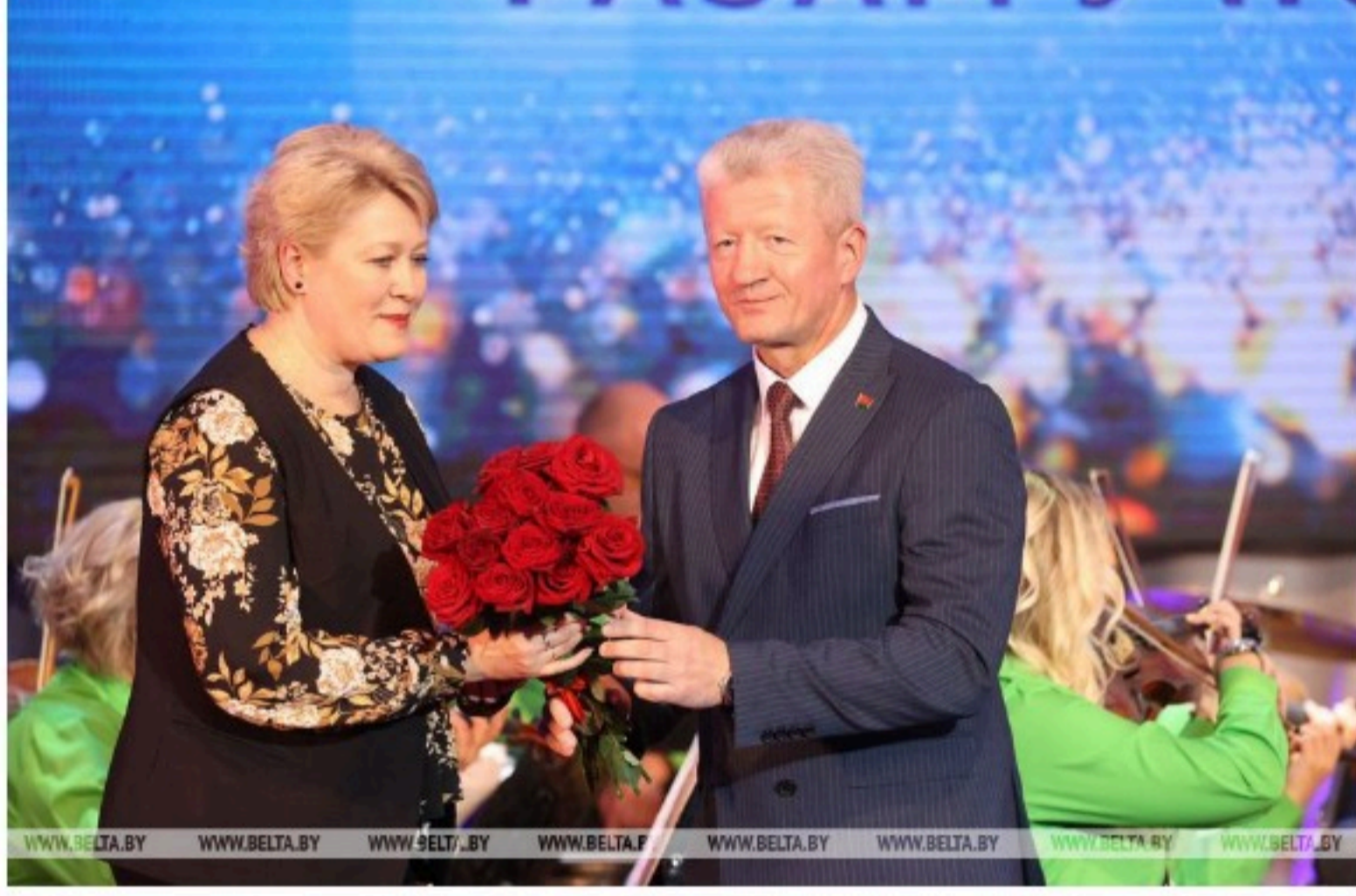
WWW.BELTA.BY WWW.BELTA.BY WWW.BELTA.BY WWW.BELTA.BY WWW.BELTA.BY WWW.BELTA.BY WWW.BELTA.BY WWW.BELTA.BY

В НББ также сегодня вручены награды республиканского конкурса "Бібліятэка - асяродак нацыянальнай культуры".