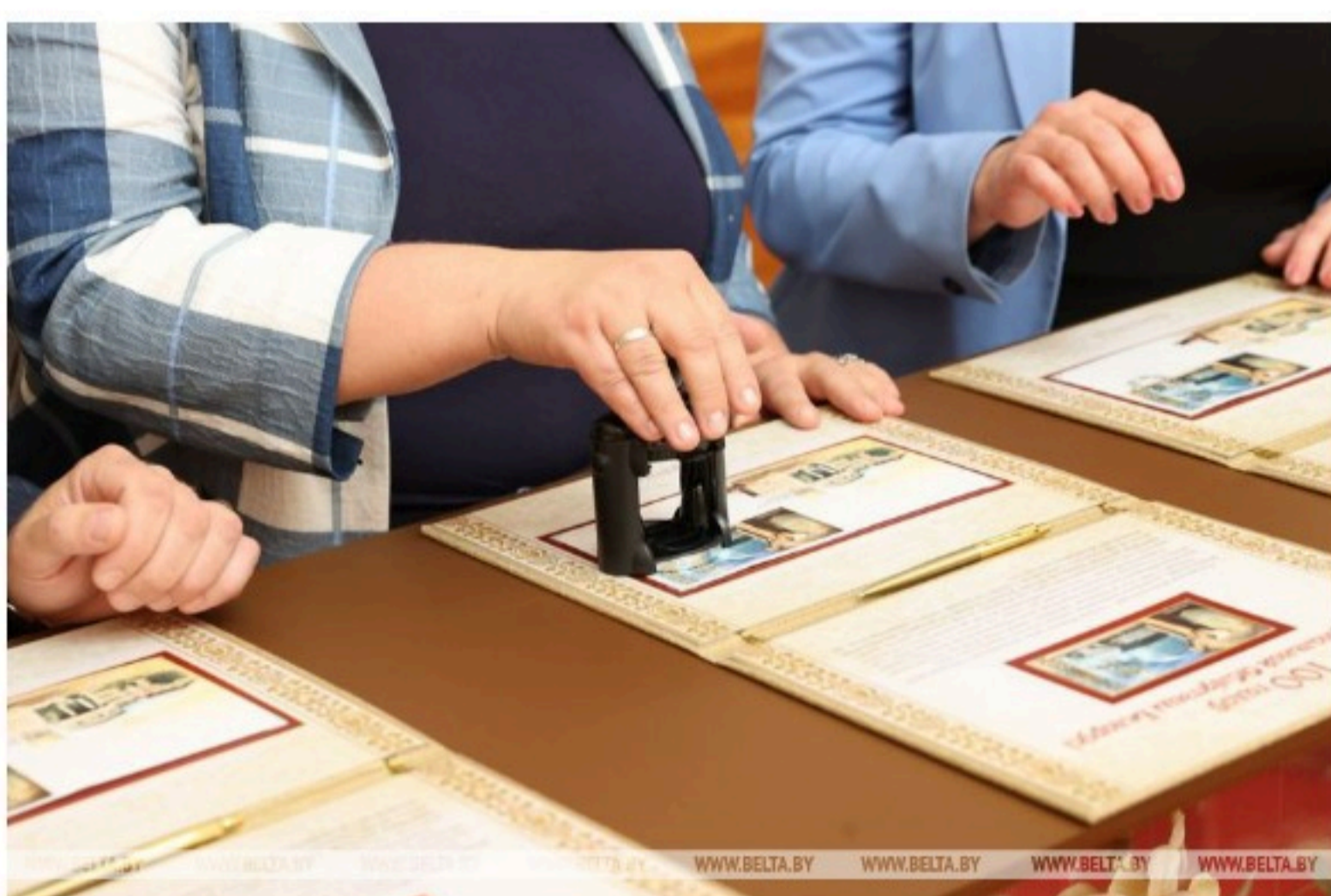
WWW.BELTA.BY WWW.BELTA.BY WWW.BELTA.BY WWW.BELTA.BY WWW.BELTA.BY WWW.BELTA.BY WWW.BELTA.BY WWW.BELTA.BY

Кроме того, состоялась церемония гашения государственного знака почтовой оплаты "100 лет Национальной библиотеке Беларуси" специальным памятным штемпелем. Знак подготовлен Министерством связи и информатизации и республиканским унитарным предприятием почтовой связи "Белпочта" в сотрудничестве с Национальной библиотекой Беларуси. Тираж почтового блока составляет 15 тыс. экземпляров, а также 7 тыс. почтовых блоков без перфорации. К слову, плодотворное сотрудничество белорусской почты с Национальной библиотекой Беларуси стало уже доброй традицией. За 25 лет в почтовое обращение введено около 30 почтовых проектов с изображением Национальной библиотеки.-0-