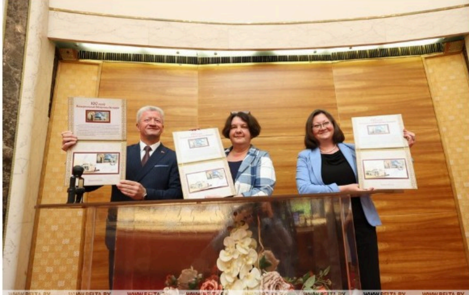
WWW.BELTA.BY WWW.BELTA.BY WWW.BELTA.BY WWW.BELTA.BY WWW.BELTA.BY WWW.BELTA.BY WWW.BELTA.BY WWW.BELTA.BY