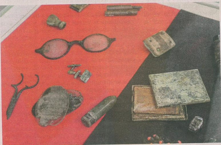
Рэчы загінулых вязняў Нясвіжскага гета.

Чатырыста тысяч чалавек было вывезена на прымусовыя работы з Беларусі. На выстаўцы можна ўбачыць нашыўку, якая была абавязковым атрыбутам адзення палонных. Таксама Нацыянальны архіў Беларусі перадаў для выстаўкі ўліковыя карткі, якія нацысты заводзілі на кожнага, каго вывозілі на працу ў Германію. У гэтых картках — дата нараджэння, кароткія звесткі пра чалавека.