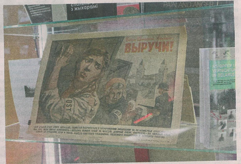
Партызанскі агітацыйны плакат.

Партызанская медыцына — адзін з самых цікавых раздзелаў праекта. У рамках экспазіцыі прадстаўлены хірургічныя інструменты, якімі аперавалі людзей непасрэдна ў зямлянках, арыгінальныя скрыні, дзе захоўваліся медыкаменты. Кожны раз, калі партызаны хадзілі ў разведку, перад імі ставілася задача — абавязкова прынесці што-небудзь для санчасці. Гэта маглі быць бінты або якія-небудзь лекі, аптэчкі.